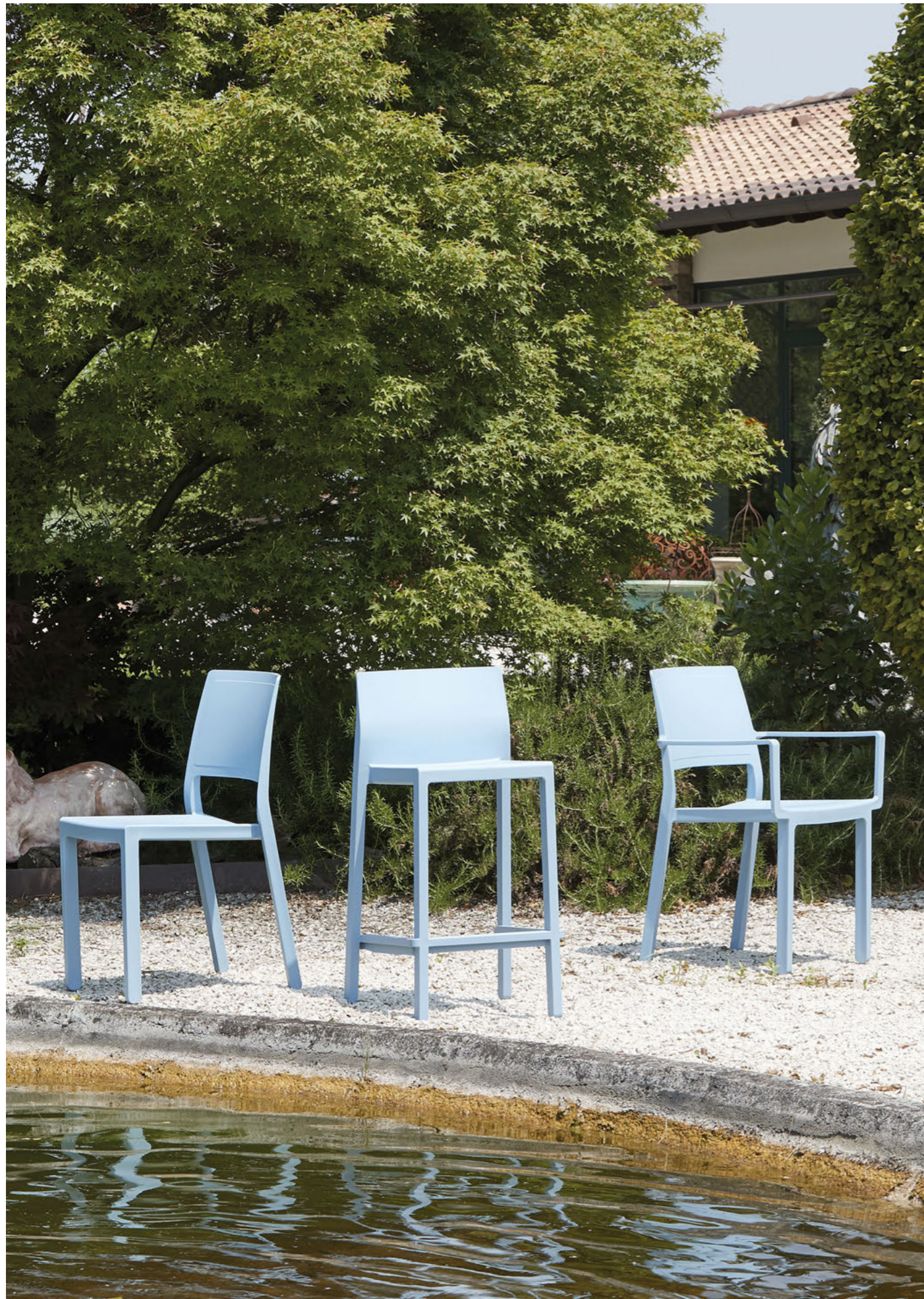
Stackable barstool Sgabello impilabile Kate, art. 2346 h.65 Stackable armchair Poltrona impilabile Kate, art. 2340