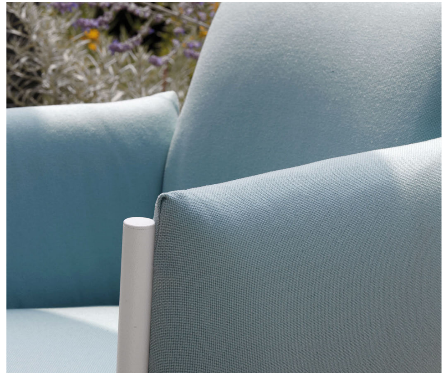
Armchair Poltrona Brezza, art. 2898 Round Coffee table rotondo Dress_Code, art. 2742 Ø 45 h.50 Square Coffee table quadrato Dress_Code, art. 2743 41x41 h.40

(En) The generous upholstery leaves the round metal legs exposed, lending strength and recognisability. (It) La generosa imbottitura lascia a vista le gambe in metallo a sezione tonda che donano forza e riconoscibilità.