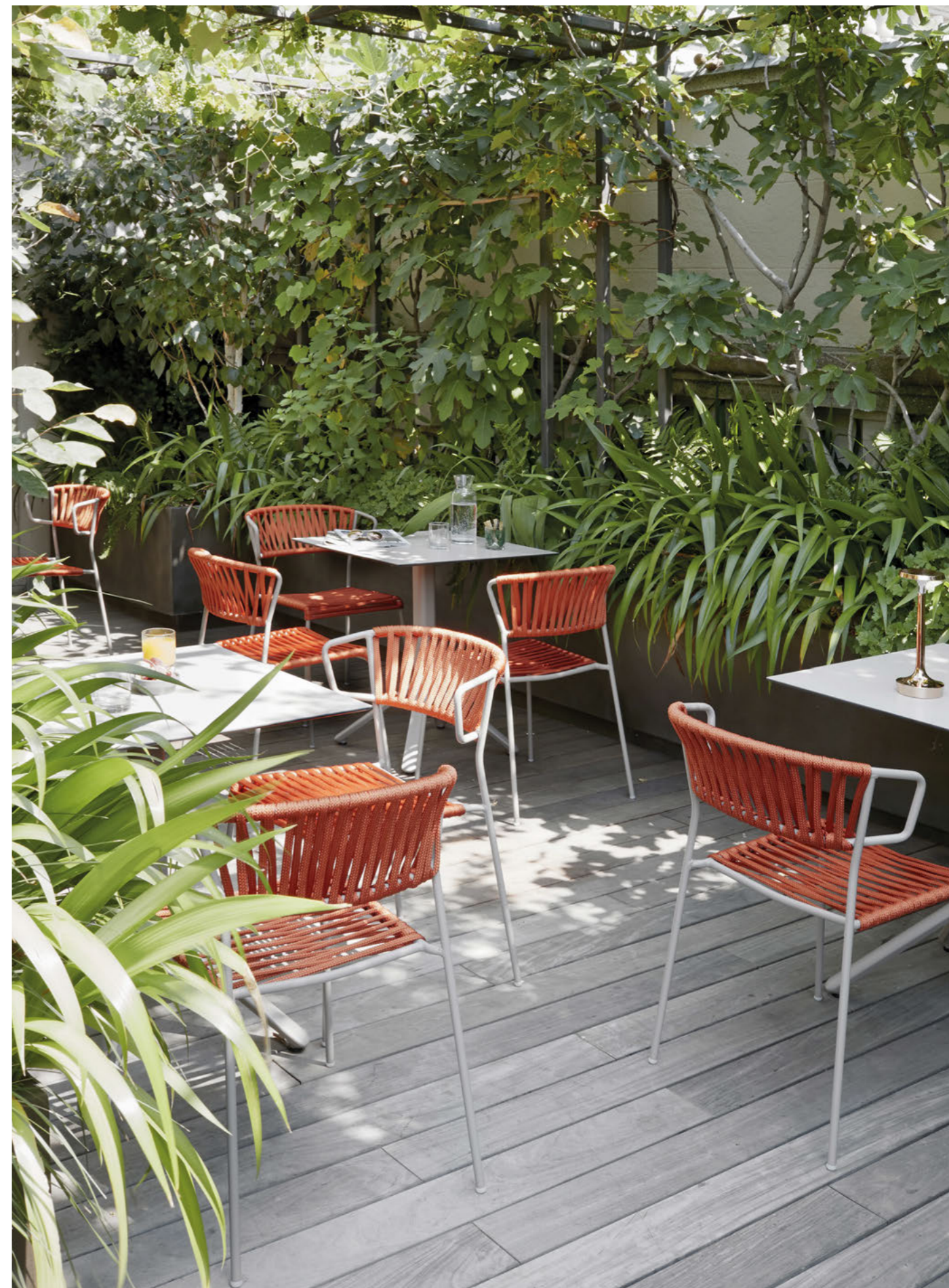
Chair Sedia Lisa Filò, art. 2870 Armchair Poltrona Lisa Filò, art. 2869

Telaio in acciaio zincato e verniciato a polvere, intreccio in corda nautica.