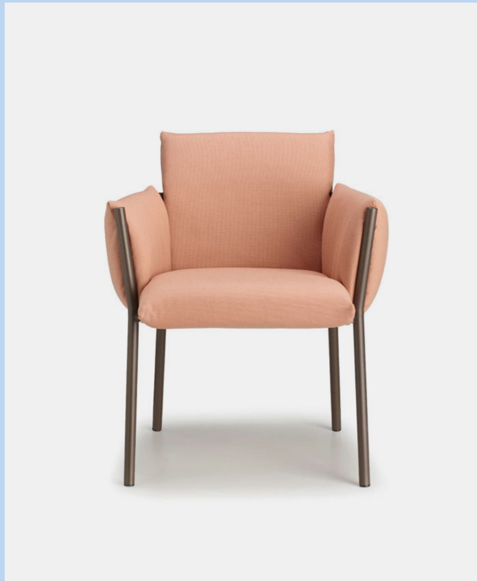
Armchair Poltrona Brezza, art. 2898

(En) The Brezza seating family expands with two new pieces, a lounge armchair and a two-seater sofa. Both inherit the production approach of the original: the soft cushions attach to the frame without the need for glue, buttons, zippers, or Velcro. (It) La famiglia di sedute Brezza si allarga a due nuovi pezzi, una poltroncina lounge e un divanetto a due posti. Entrambi ereditano dalla capostipite l'approccio produttivo: i morbidi cuscini si fissano al telaio senza bisogno di colle, bottoni, zip o velcro.