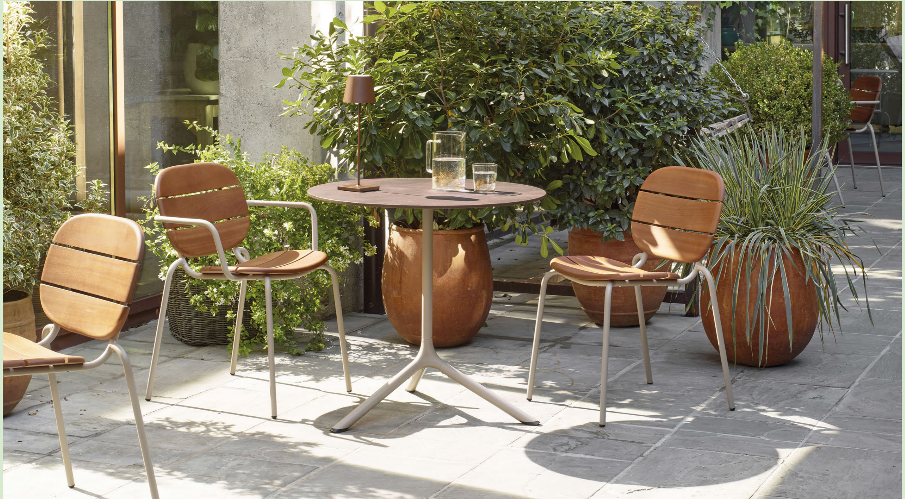
Base Tripé Maxi, art. 5006 h.73