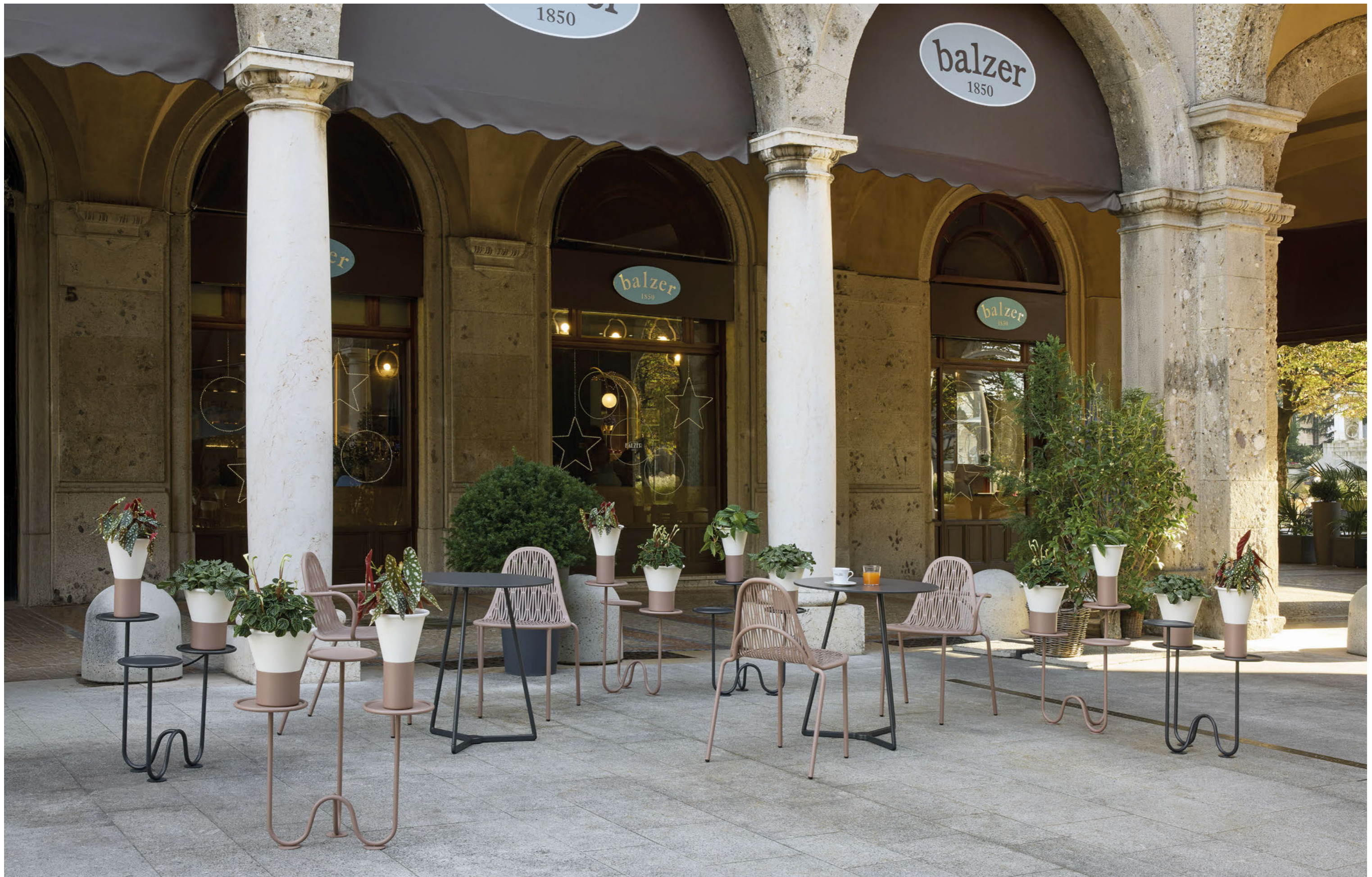
Vases Vasi Mimosa, art. 2958 h.31 Vases Vasi Mimosa, art. 2957 h.25 Plant holder floor Porta piante da terra Mimosa, art. 2956