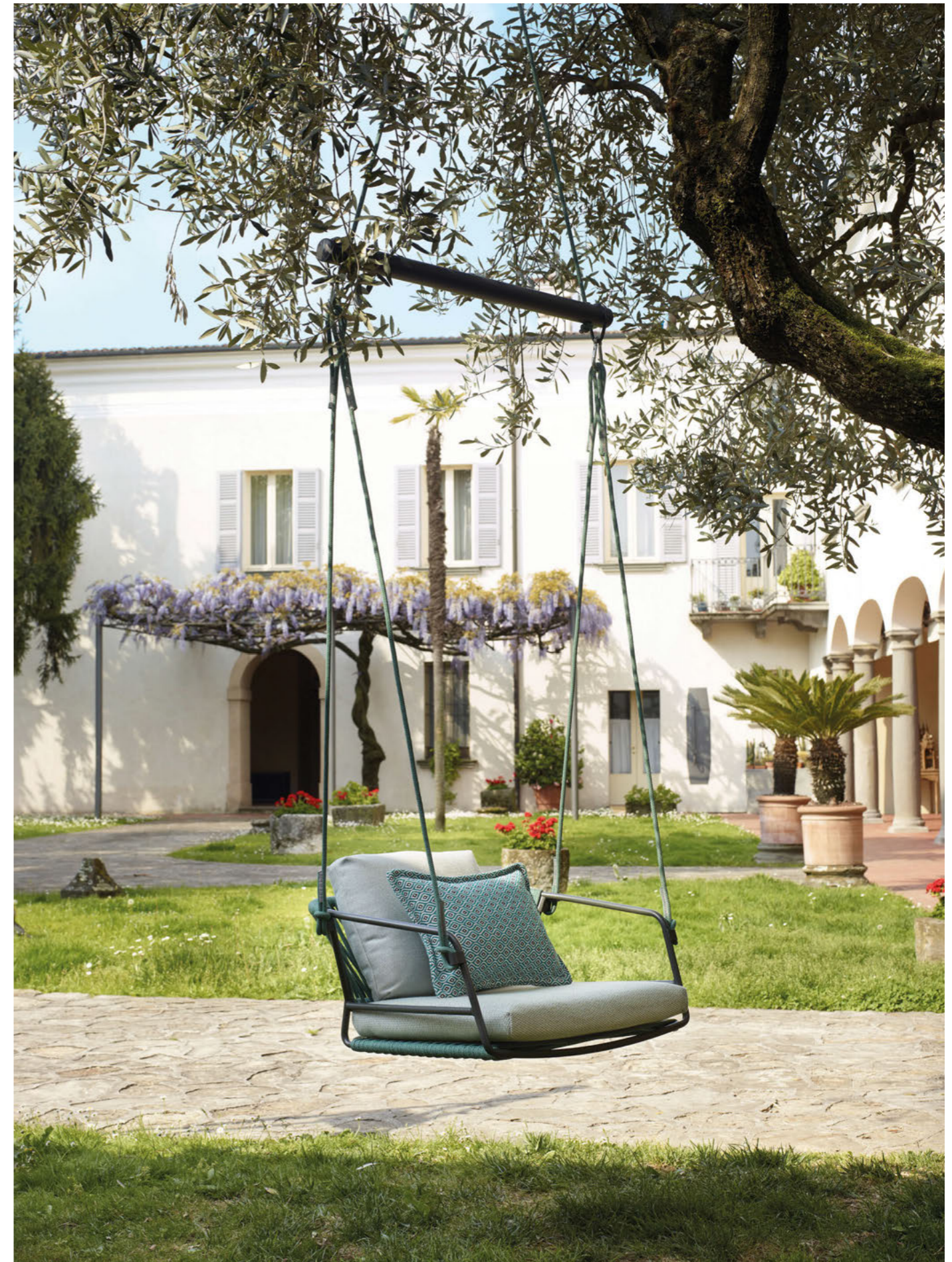
Hanging armchair Seduta Sospesa Lisa Swing, art. 2883

Telaio in acciaio zincato e verniciato a polvere, intreccio in corda nautica. Optional: cuscini tessuto Sunbrella®.