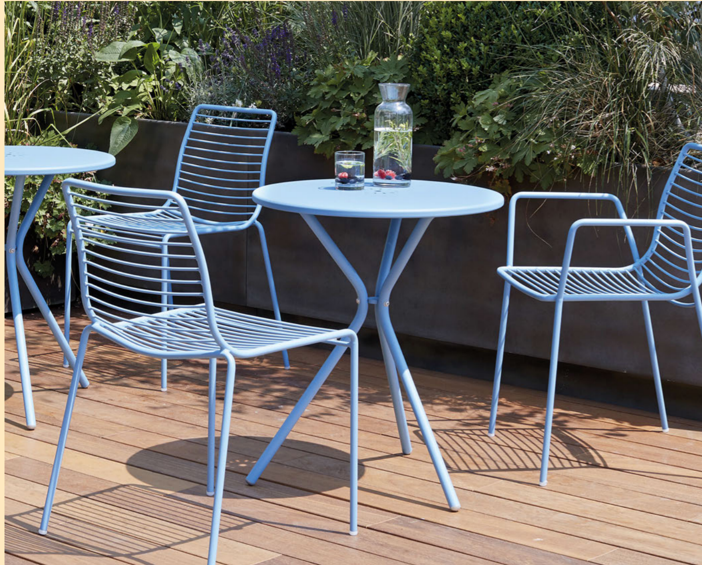
Table Tavolo Leo, art. 2719 Ø 60 h.73 Stackable chair Sedia impilabile Summer, art. 2522 Stackable armchair Poltrona impilabile Summer, art. 2520