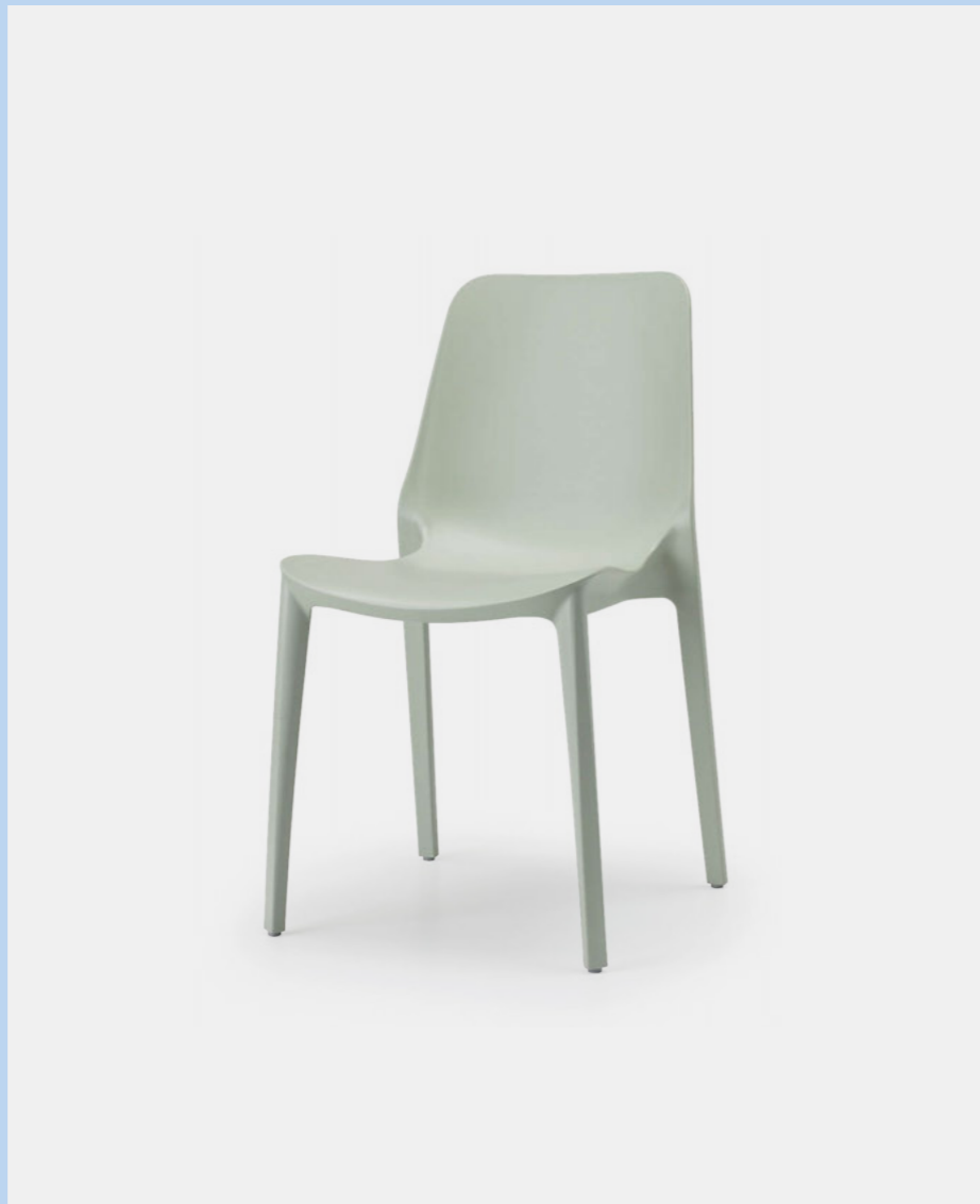
Stackable chair Sedia impilabile Ginevra, art. 2334

Also available in Go Green version. Disponibile anche in versione Go Green.