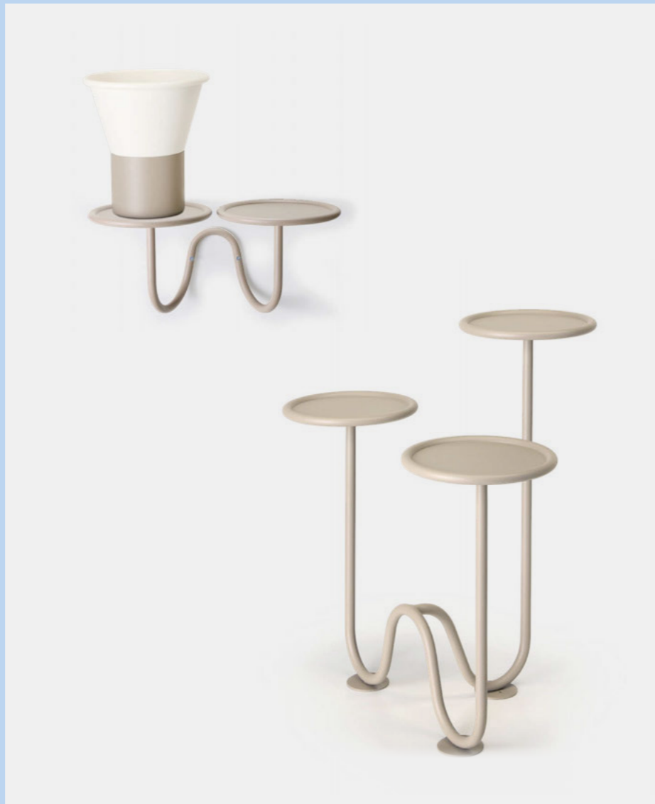
Plant holder wall mounted Porta piante da parete Mimosa, art. 2955 Plant holder floor Porta piante da terra Mimosa, art. 2956

(En) The Mimosa family of accessories is designed to showcase vegetation within our living spaces. As if suspended in levitation, these rounded supports welcome floral compositions or ornamental plants, while the sinuous tube connecting the trays evokes the idea of a root or rhizome with a line. Lively and colourful, these plant holders can be placed in a corner, against a wall, or wall-mounted, infusing softness and a sense of coziness into any environment. (It) La famiglia di accessori Mimosa è studiata per mettere in scena la vegetazione all'interno dei nostri spazi di vita. Come sospesi in levitazione, questi supporti arrotondati accolgono composizioni floreali o piante ornamentali, mentre il tubolare sinuoso che collega i vassoi evoca con una linea l'idea di radice o rizoma. Grafici e colorati, questi porta pianta possono essere inseriti in un angolo, contro un muro o come applique, infondendo morbidezza e senso di accoglienza ad ogni ambiente.