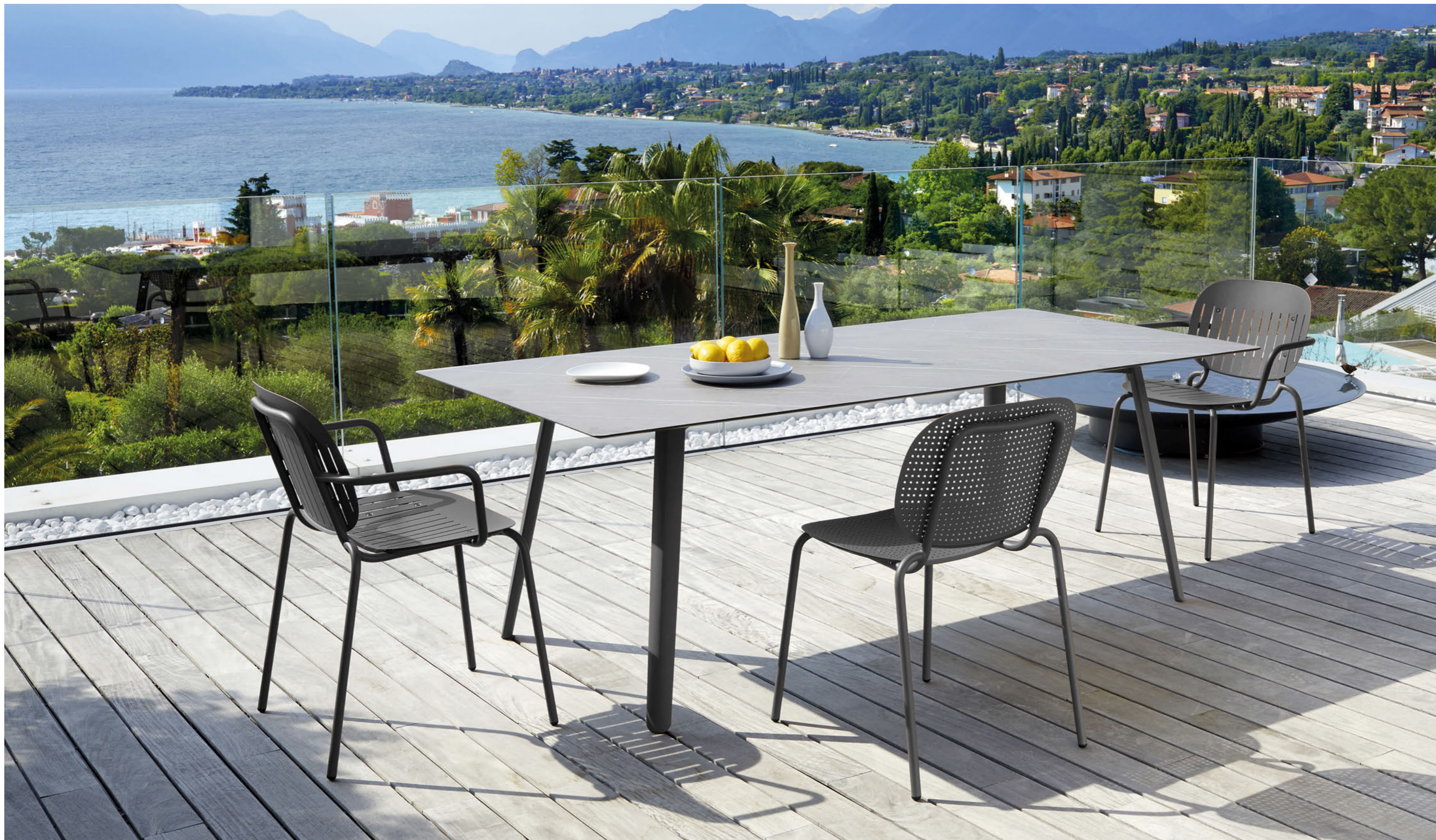
Rectangular Table Tavolo Squid rettangolare - 210x100, art. 2431 Piasentina stone effect top / Piano effetto pietra piasentina Armchair Poltrona Si-Si Barcode, art. 2507 Chair Sedia Si-Si Dots, art. 2505