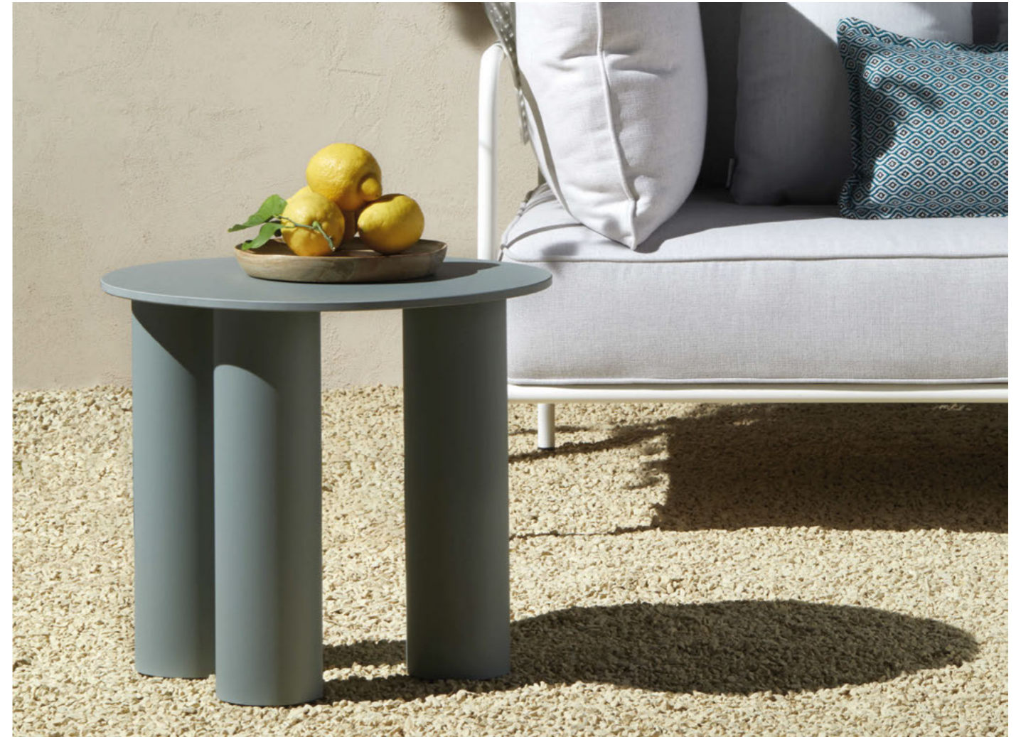
Coffee Table Hyppo, art. 2756