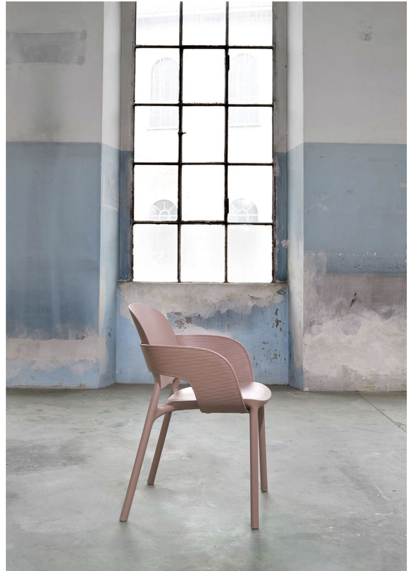
Armchair Poltrona Hug, art. 2382