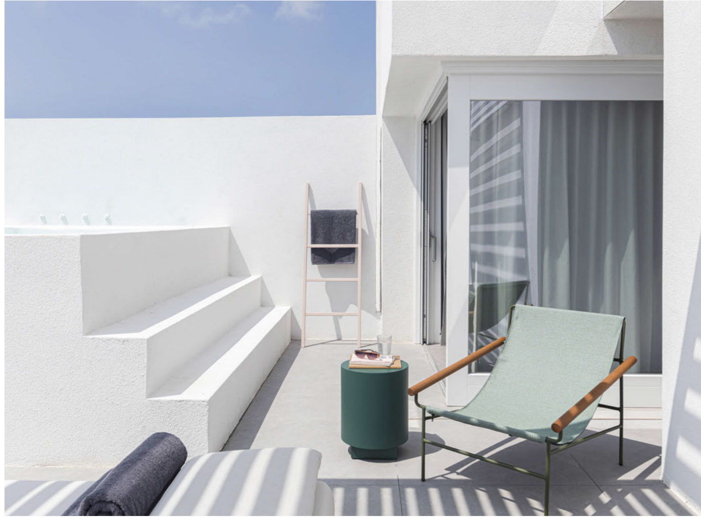
Lounge armchair Poltrona Dress_Code Smart, art. 2581