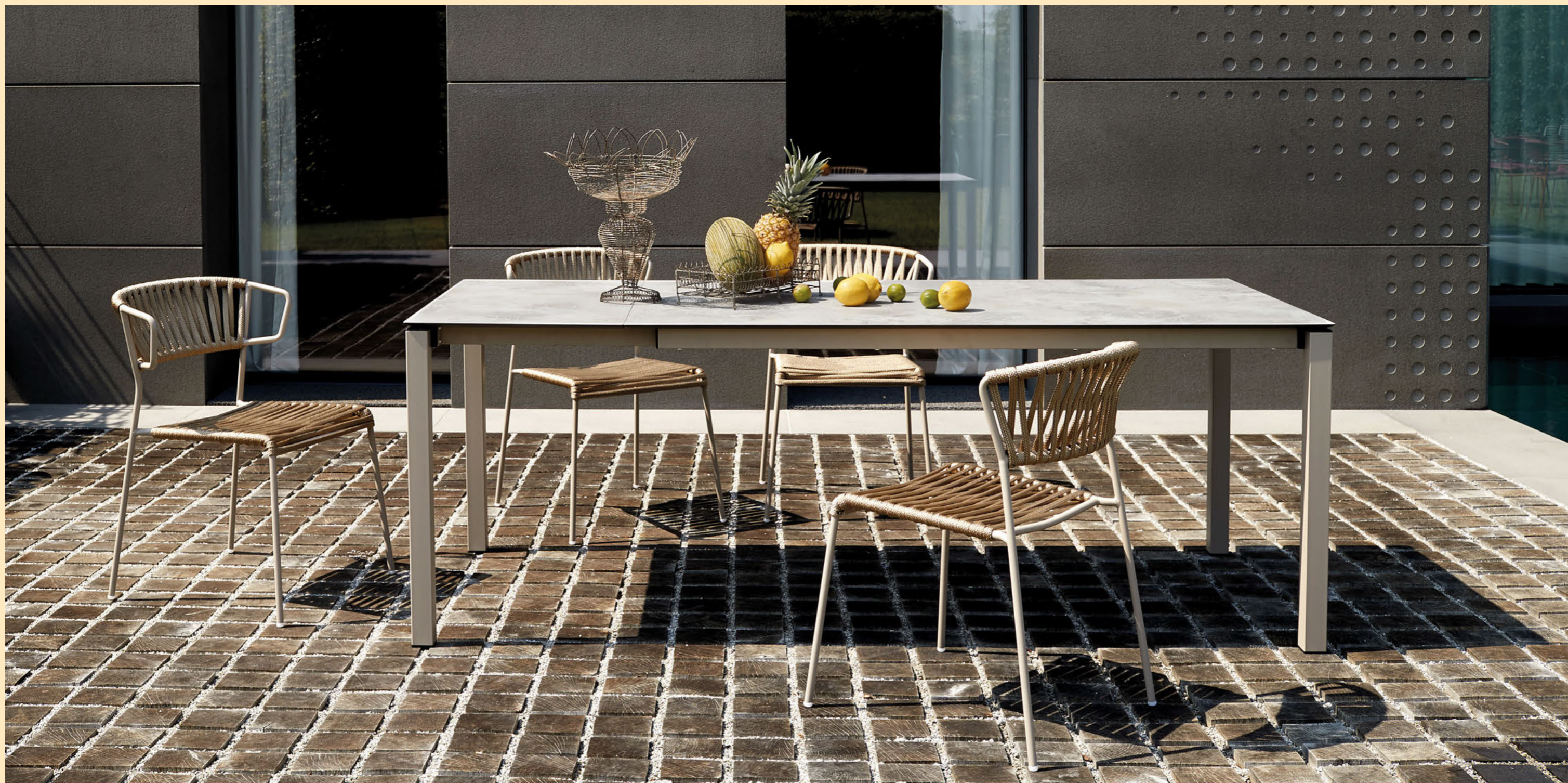
Extendable table Tavolo Pranzo Allungabile 160/210, art. 2418 h.75