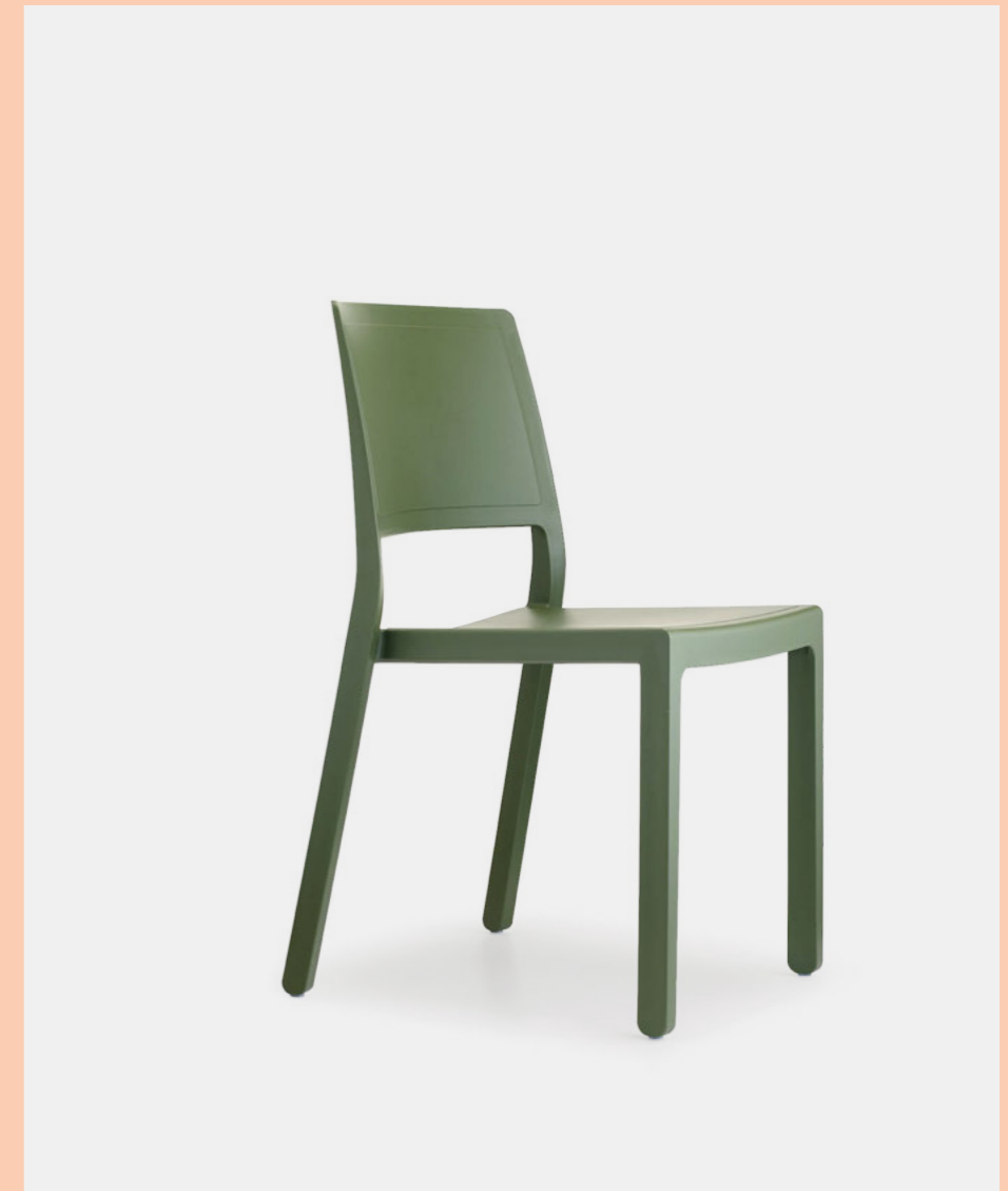
Stackable chair Sedia impilabile Kate, art. 2341