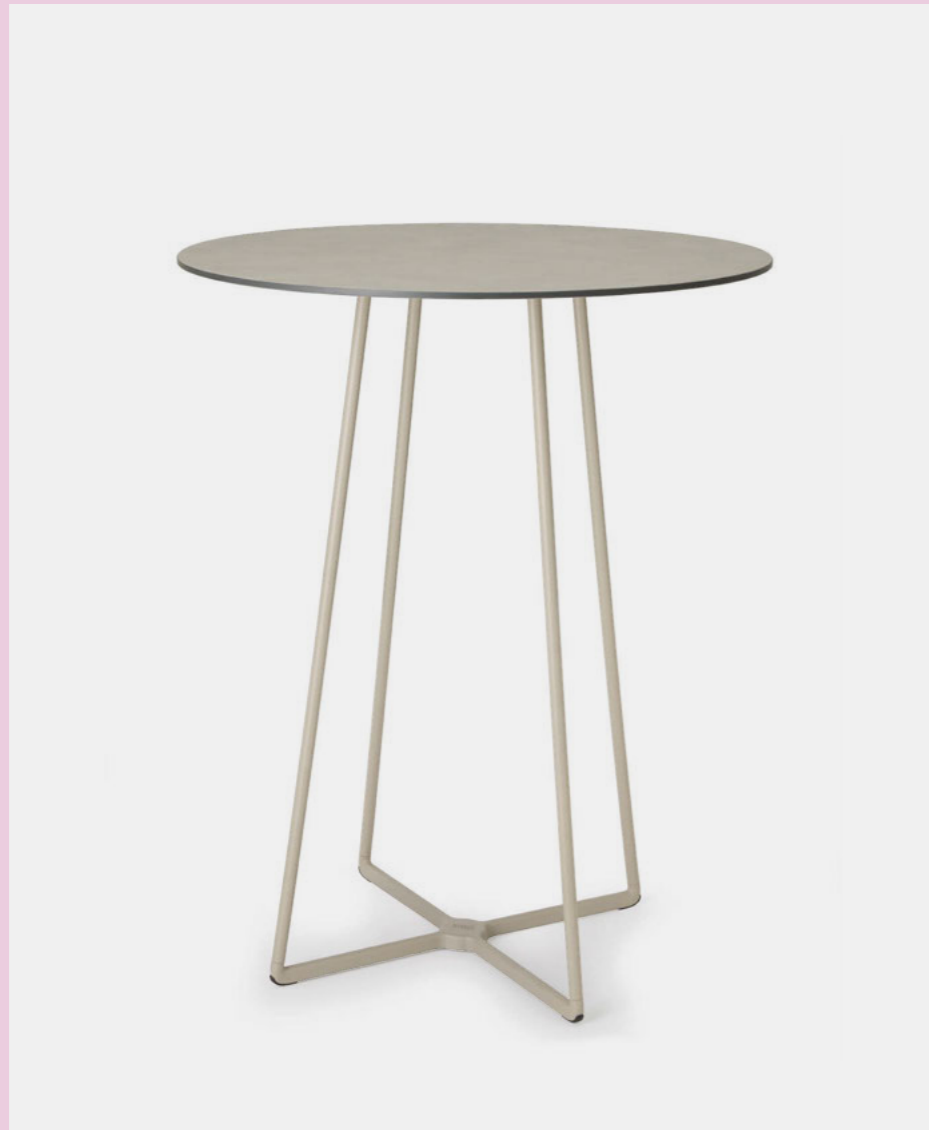
4 Legs Base Atomo, art. 5035 h.109

(It) Il progetto di Atomo nasce dall'esigenza di dare vita ad un tavolo capace di inserirsi in ogni ambiente fino a diventarne l'elemento focalizzante. Leggera e robusta, la struttura metallica è composta da una base a terra in alluminio pressofuso su cui si innestano le gambe in acciaio.