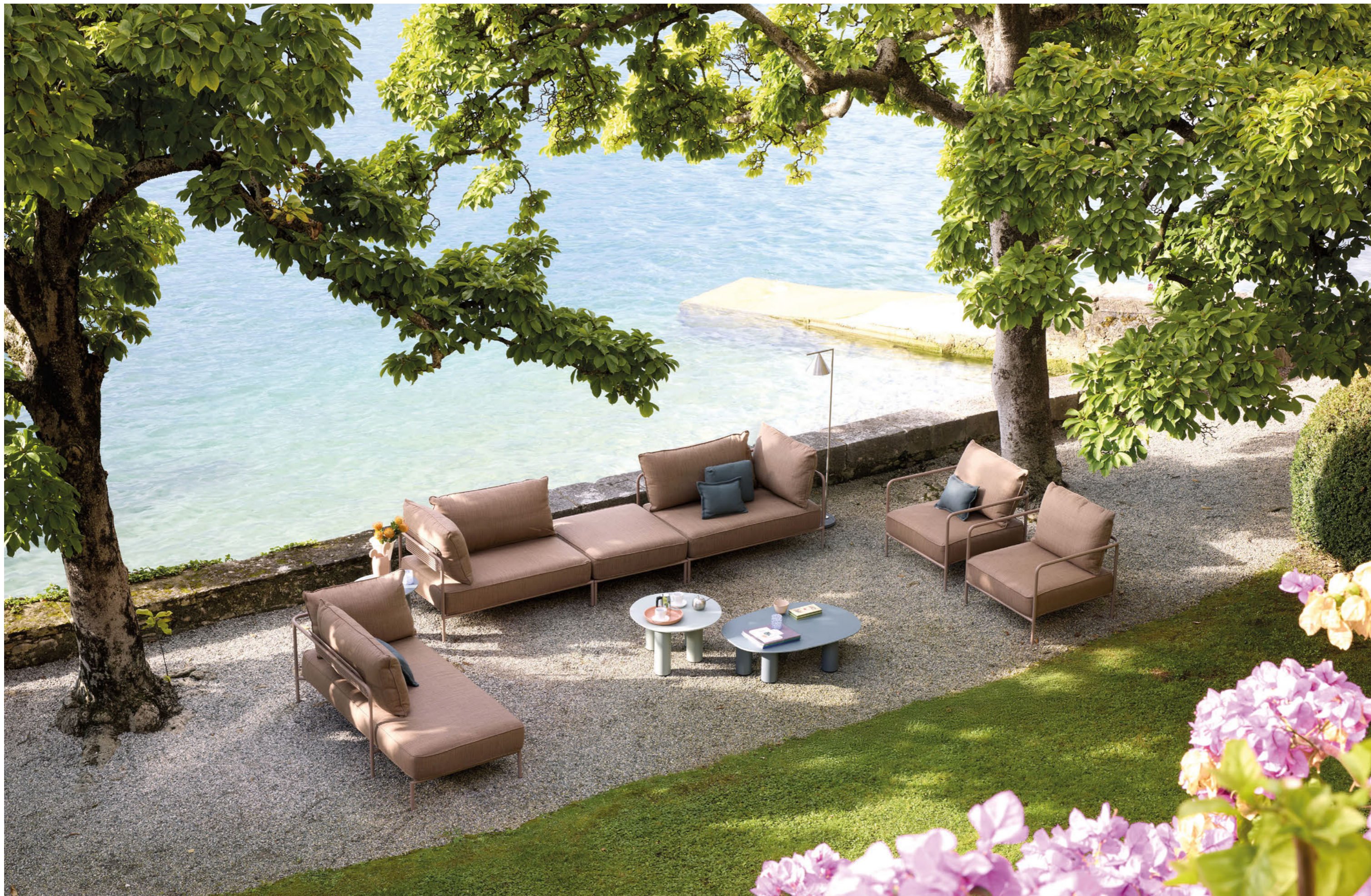
Modular system Sistema modulare Flap, art. 2903 - 2887 - 2904 - 2889 - 2905 Coffee table Hyppo, art. 2757 - 2758