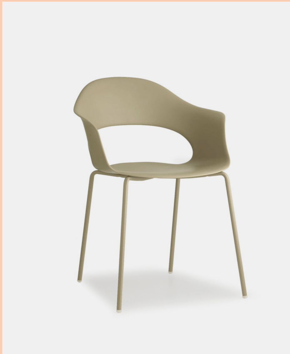
Armchair Poltrona Lady B, art. 2696

Technopolymer seat. Scocca in tecnopolimero.