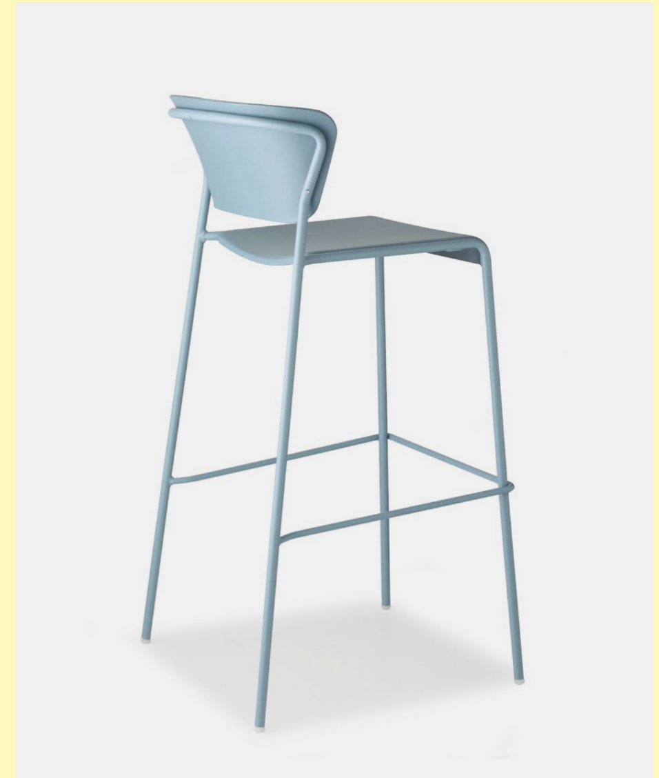
Barstool Sgabello Lisa Tecnopolimero, art. 2867 h.75