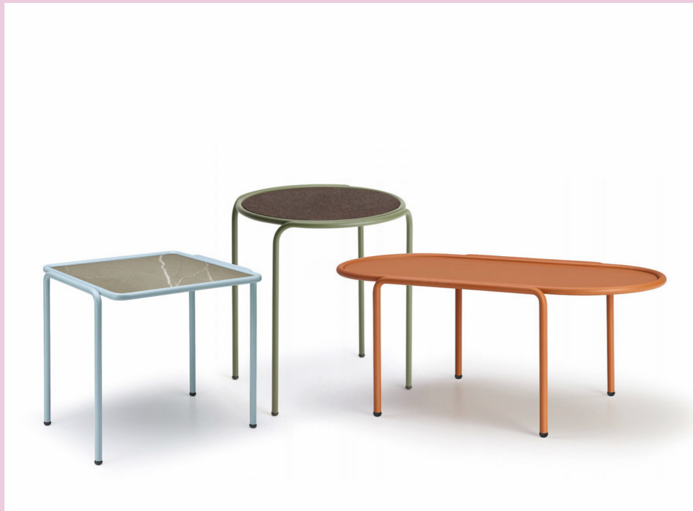
Round Coffee table rotondo Dress_Code, art. 2742 Ø 45 h.50 Oval Coffee table ovale Dress_Code, art. 2744 36x77 h.30 Square Coffee table quadrato Dress_Code, art. 2743 41x41 h.40