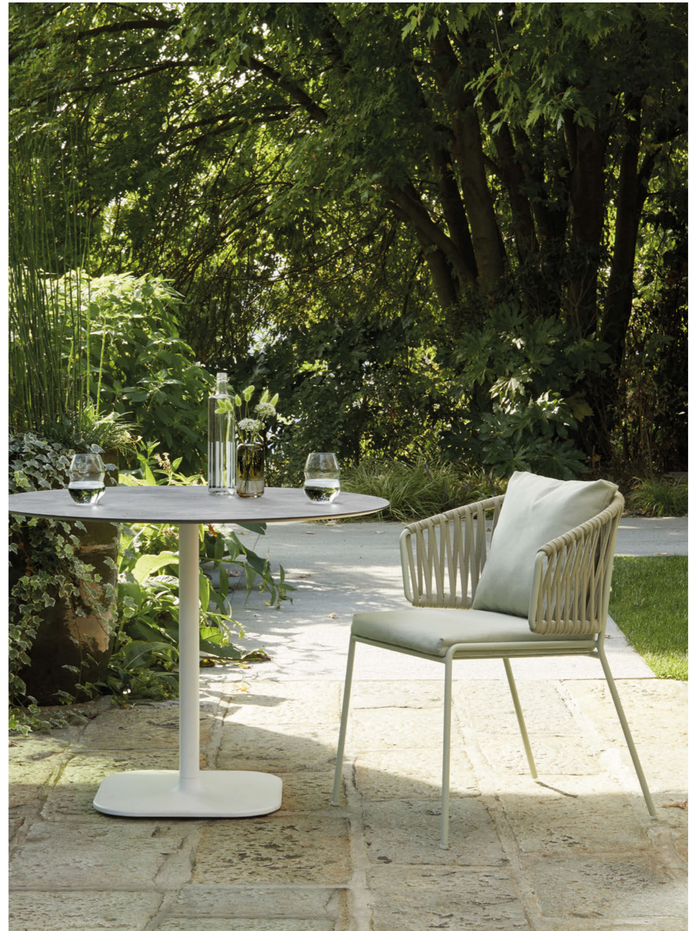
Armchair Poltrona Lisa Filò Nest, art. 2899

Telaio in acciaio verniciato a polvere, intreccio in corda nautica. Cuscini tessuto acrilico.