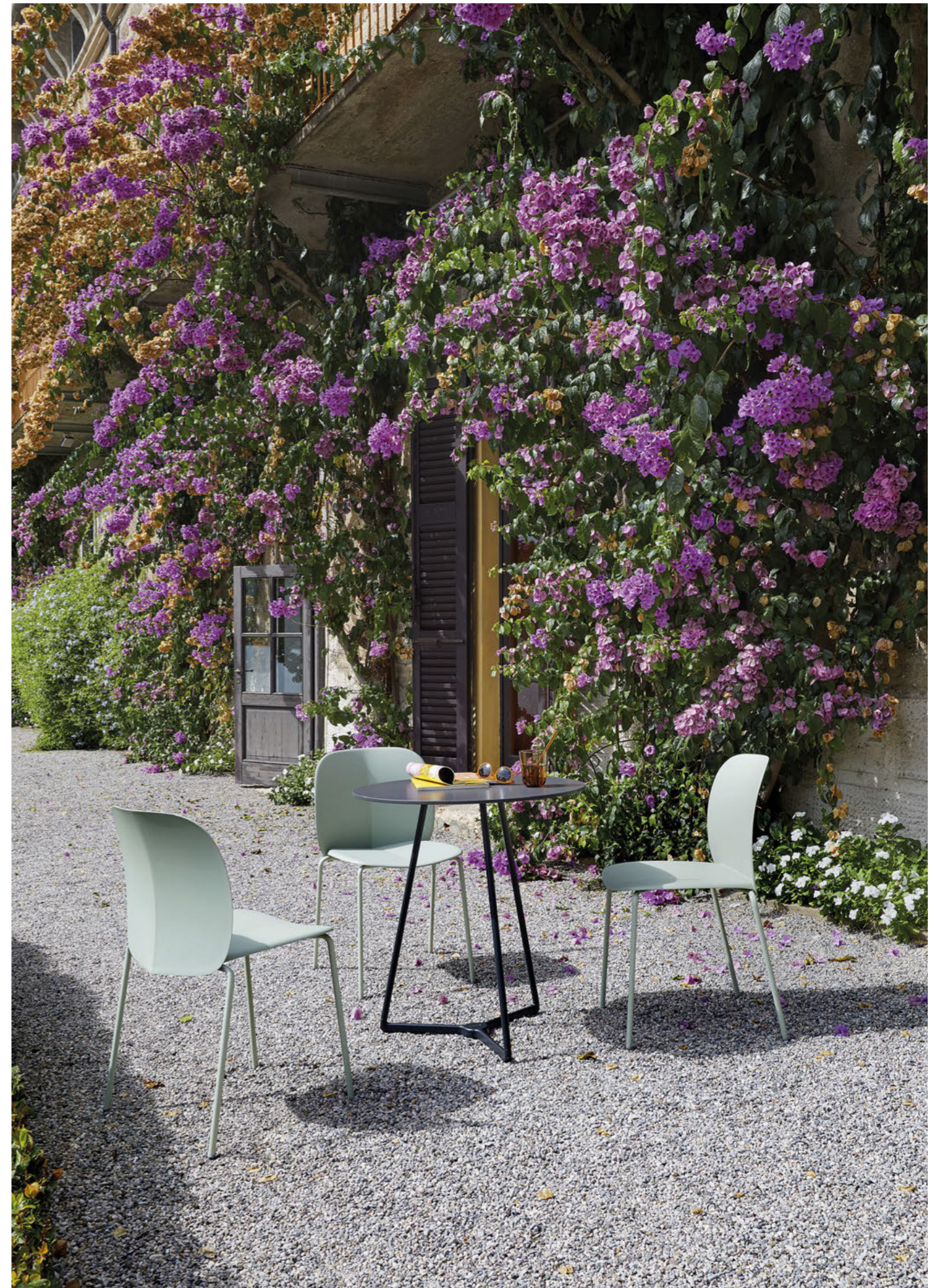
3 Legs Base Atomo, art. 5032 h.73 Chair Sedia Mentha, art. 2706

(En) Mentha is a cool, comfortable and cosy seat, made from certified recycled plastic. Mentha is a seating system, the shell can be paired with a variety of frames, making it a highly versatile collection. (It) Mentha è una seduta fresca, pratica, confortevole e accogliente in plastica certificata riciclata. Mentha rappresenta un sistema di sedute, la scocca viene montata su diverse tipologie di telaio: per questo è una collezione altamente versatile.