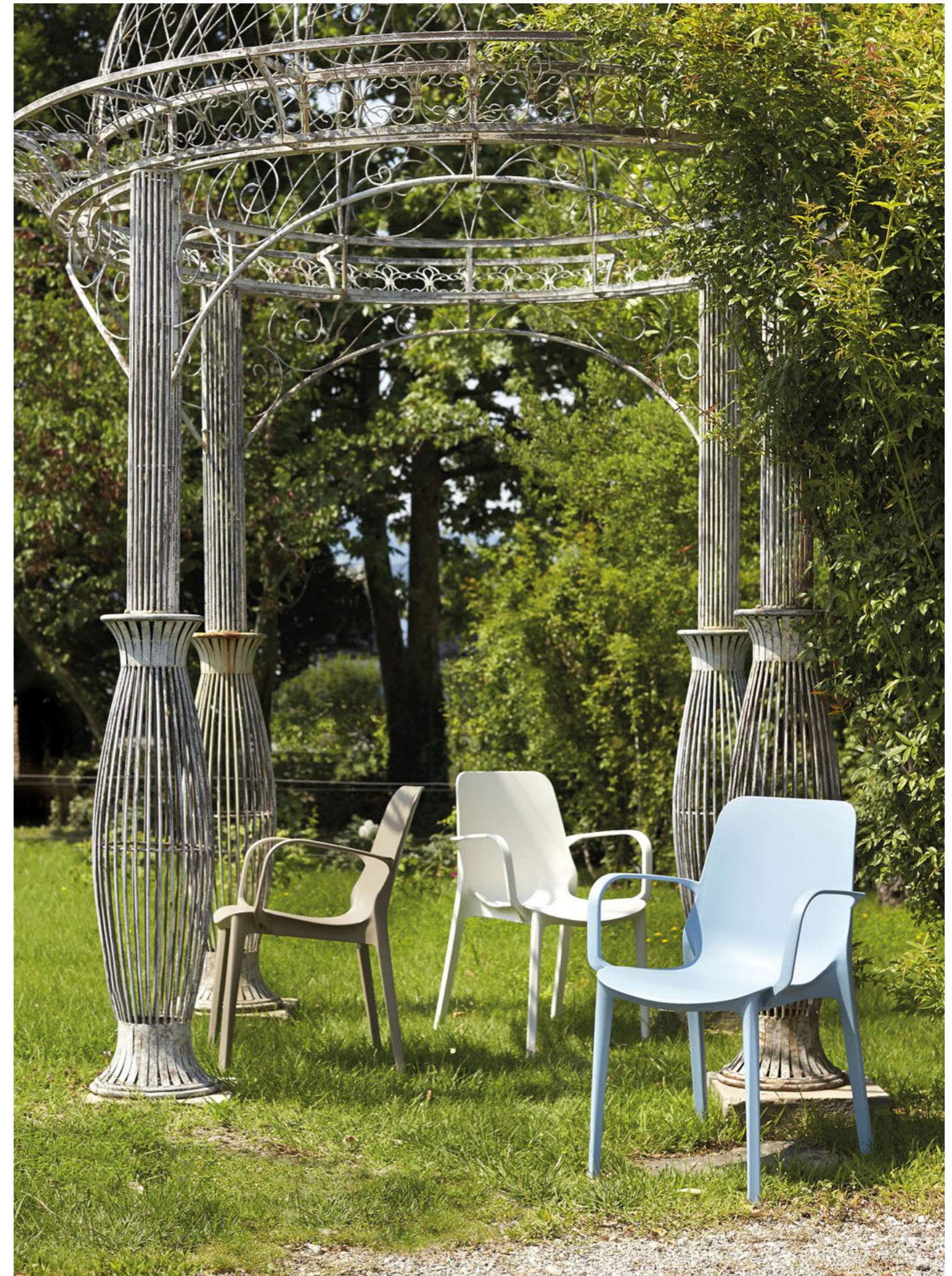
Stackable armchair Poltrona impilabile Ginevra, art. 2333

Also available in Go Green version. Disponibile anche in versione Go Green.