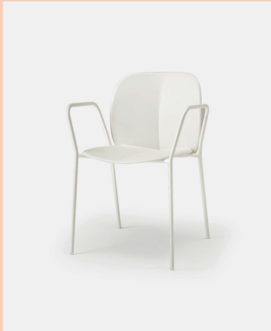
Armchair Poltrona Mentha, art. 2707

(En) Mentha is a cool, comfortable and cosy seat, made from certified recycled plastic. Mentha is a seating system, the shell can be paired with a variety of frames, making it a highly versatile collection. (It) Mentha è una seduta fresca, pratica, confortevole e accogliente in plastica certificata riciclata. Mentha rappresenta un sistema di sedute, la scocca viene montata su diverse tipologie di telaio: per questo è una collezione altamente versatile.