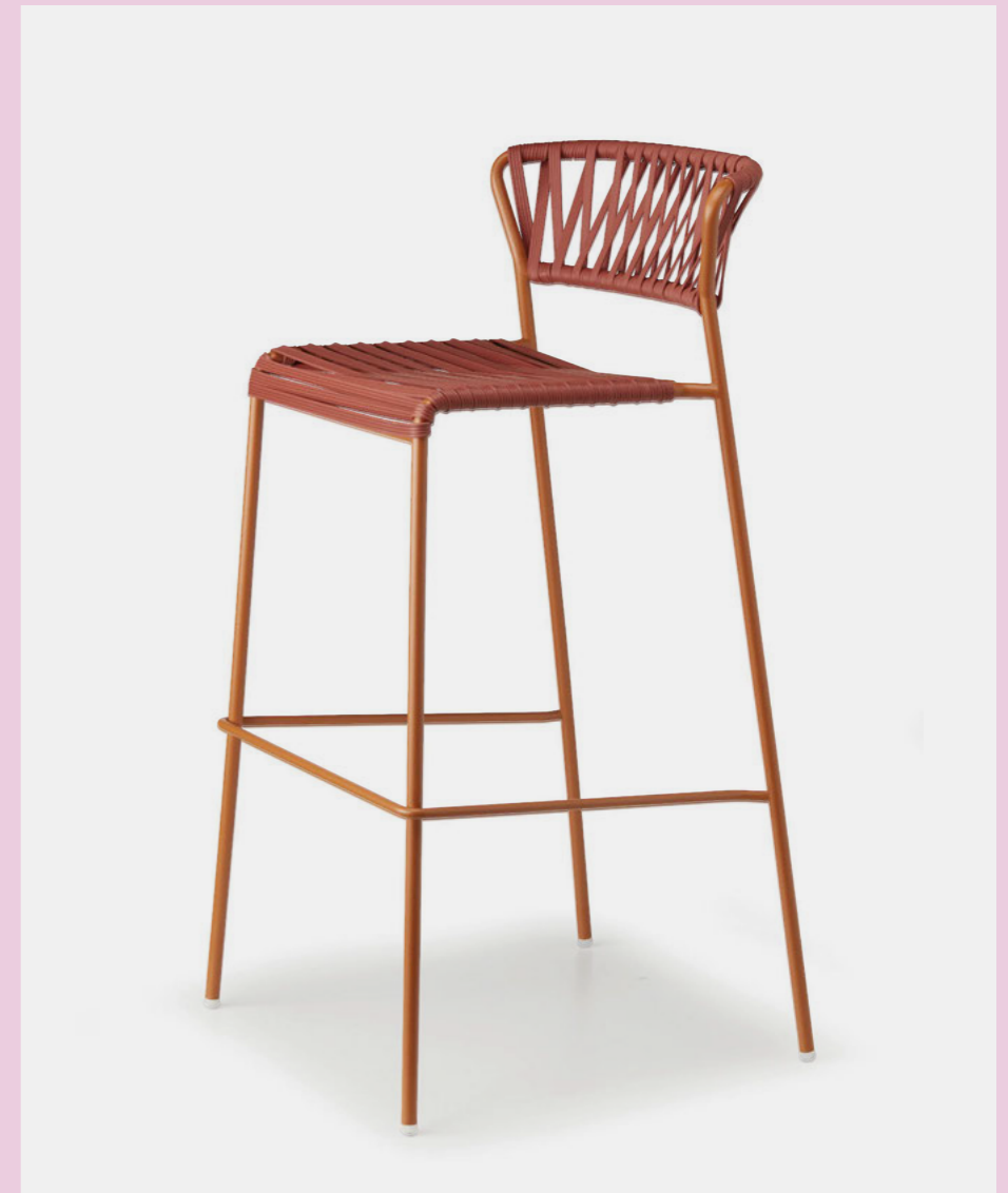
Barstool Sgabello Lisa Club, art. 2875 h.75