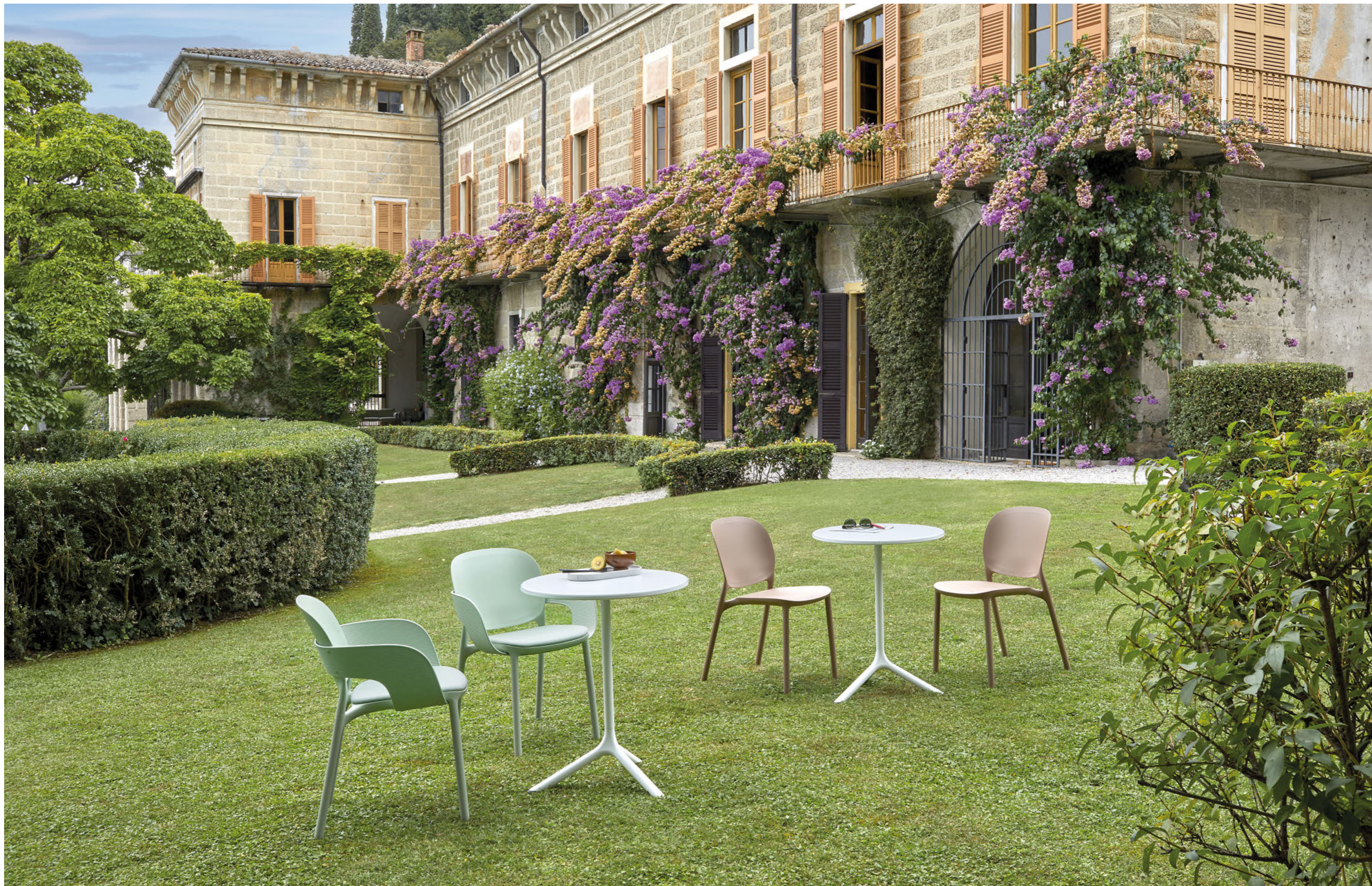
Chair Sedia Hug, art. 2380 Armchair Poltrona Hug, art. 2382 Base Tripé, art. 5000 h. 73