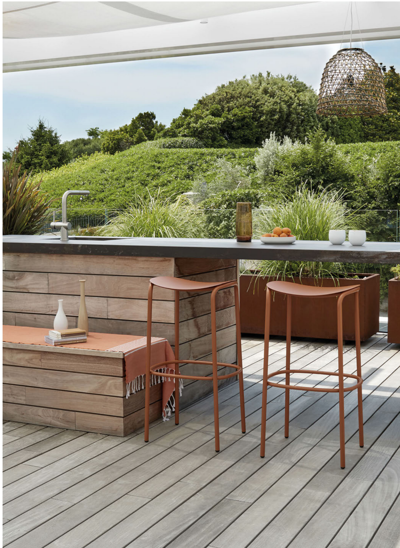
Barstool Sgabello Trick, art. 2523 h.75

Struttura in acciaio zincato e verniciato a polvere.