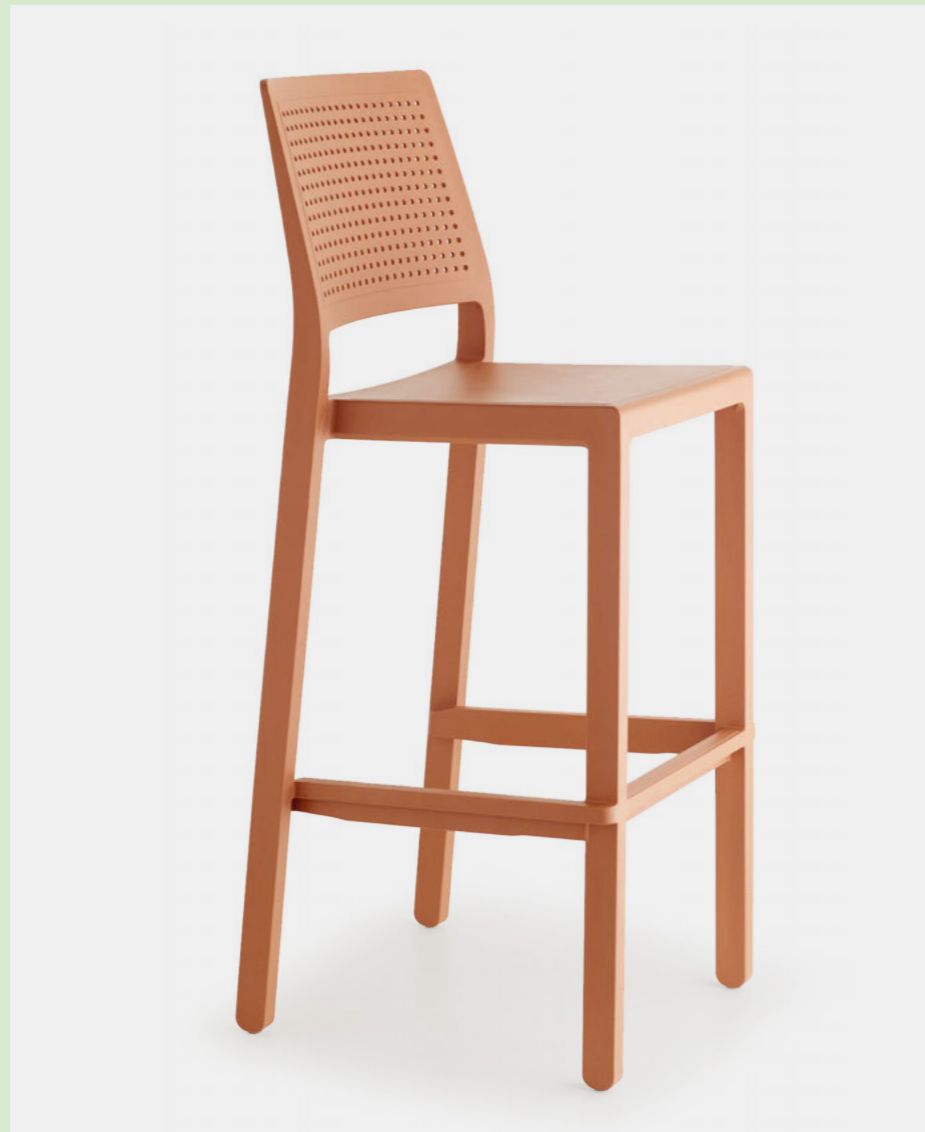
Stackable barstool Sgabello impilabile Emi, art. 2345 h.75