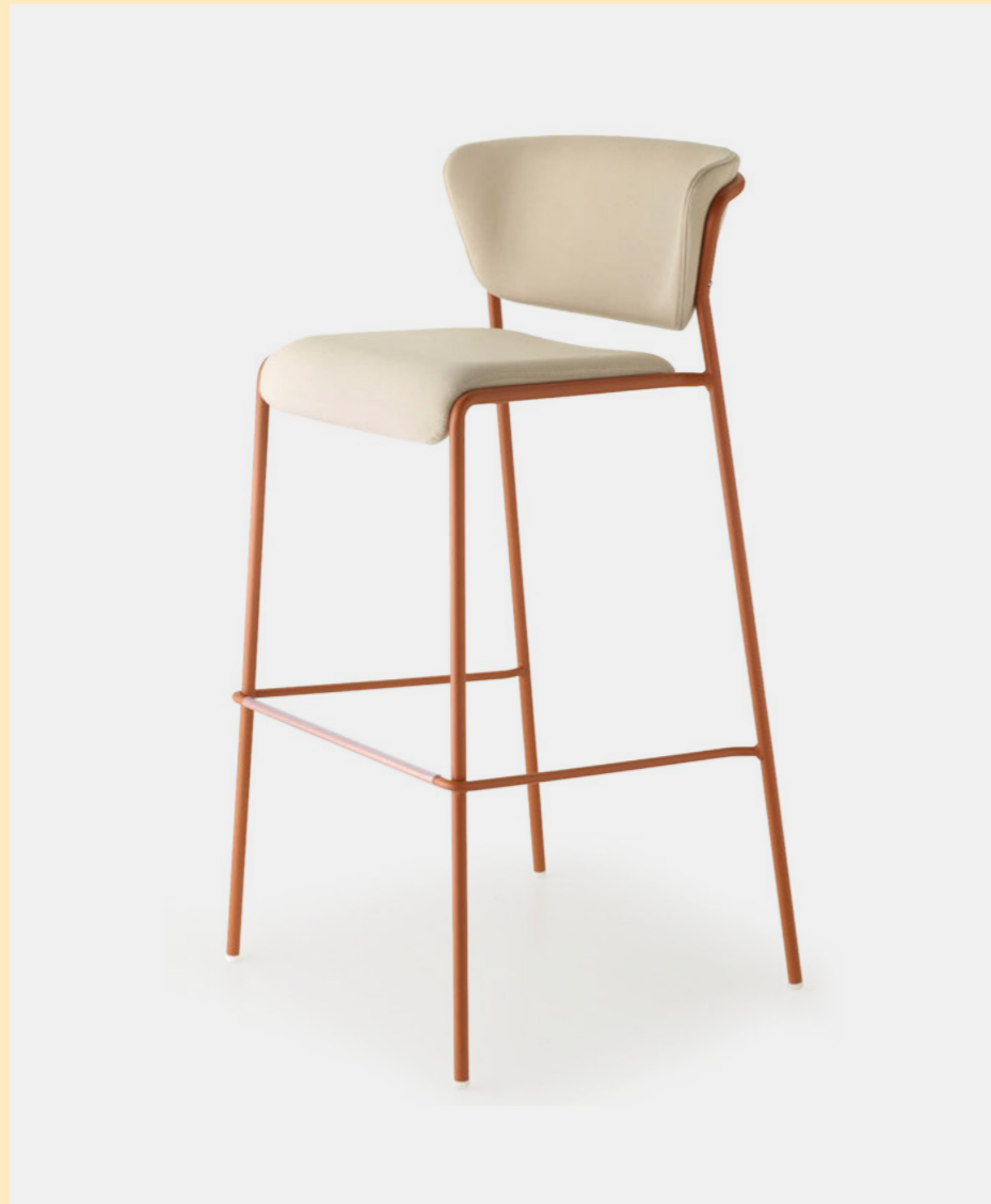
Barstool Sgabello Lisa Waterproof, art. 2862 h.75