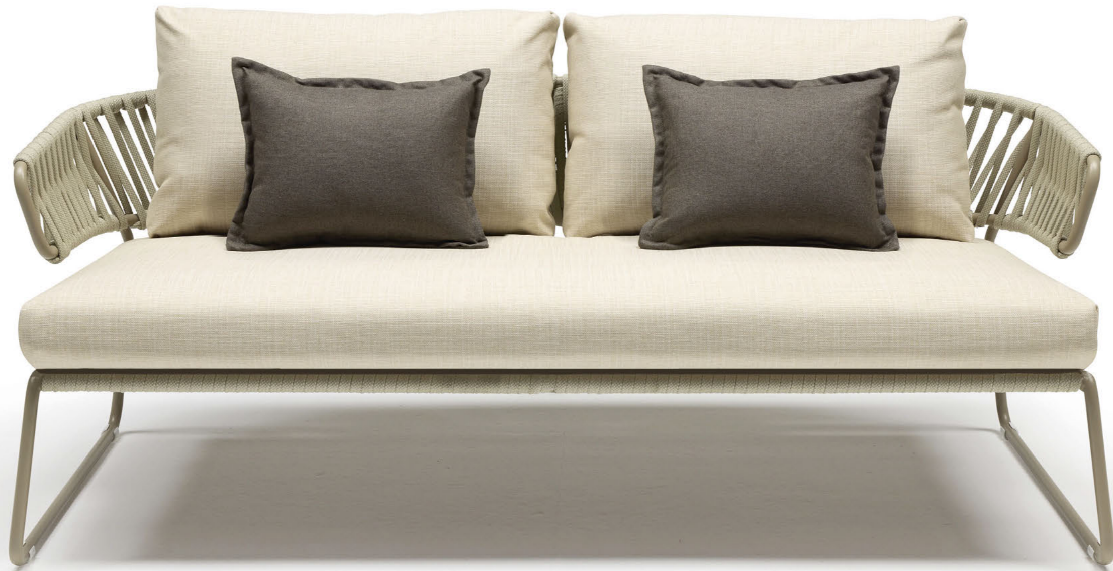
Lisa Sofa Filò, art. 2884