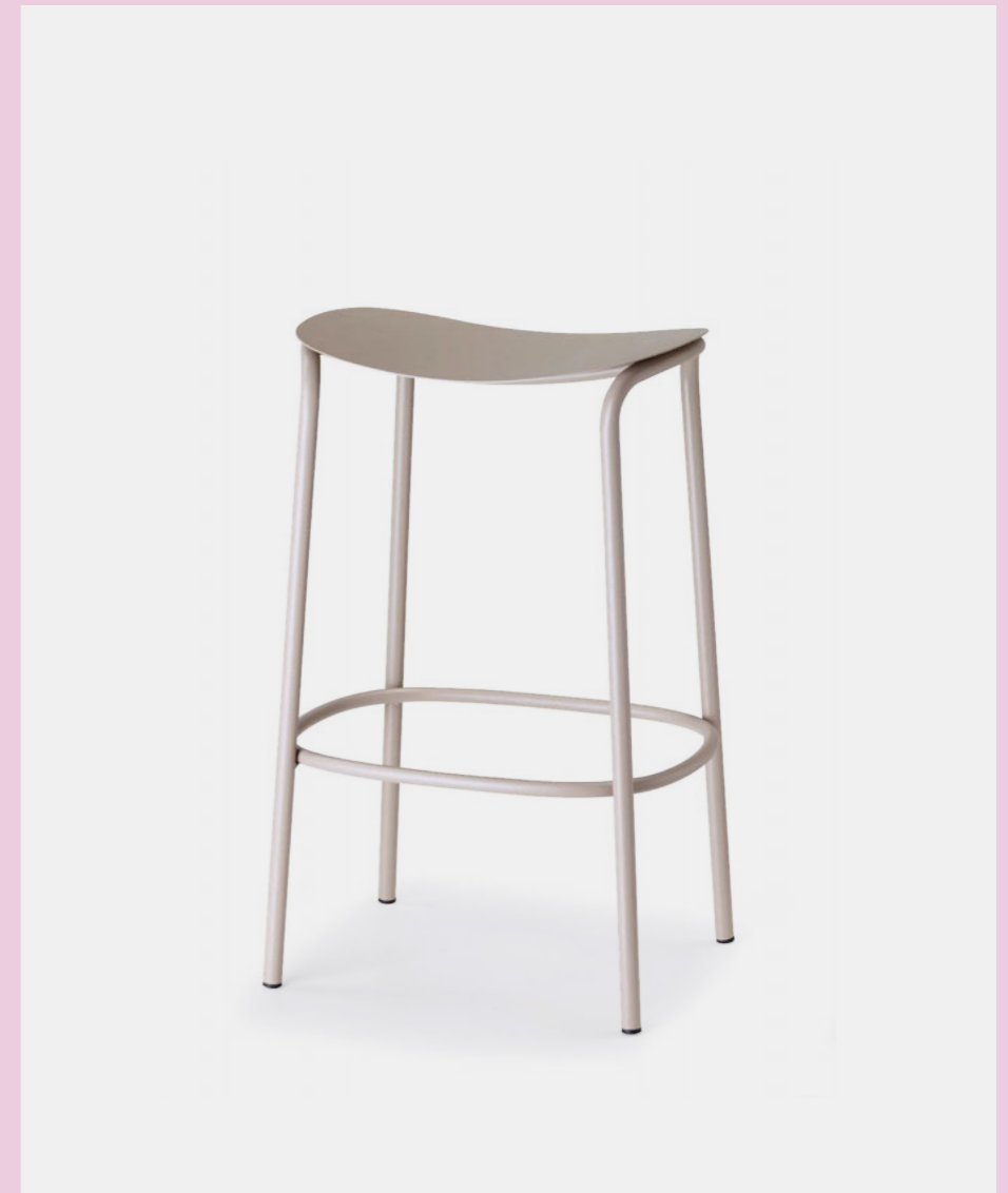
Barstool Sgabello Trick, art. 2524 h.65