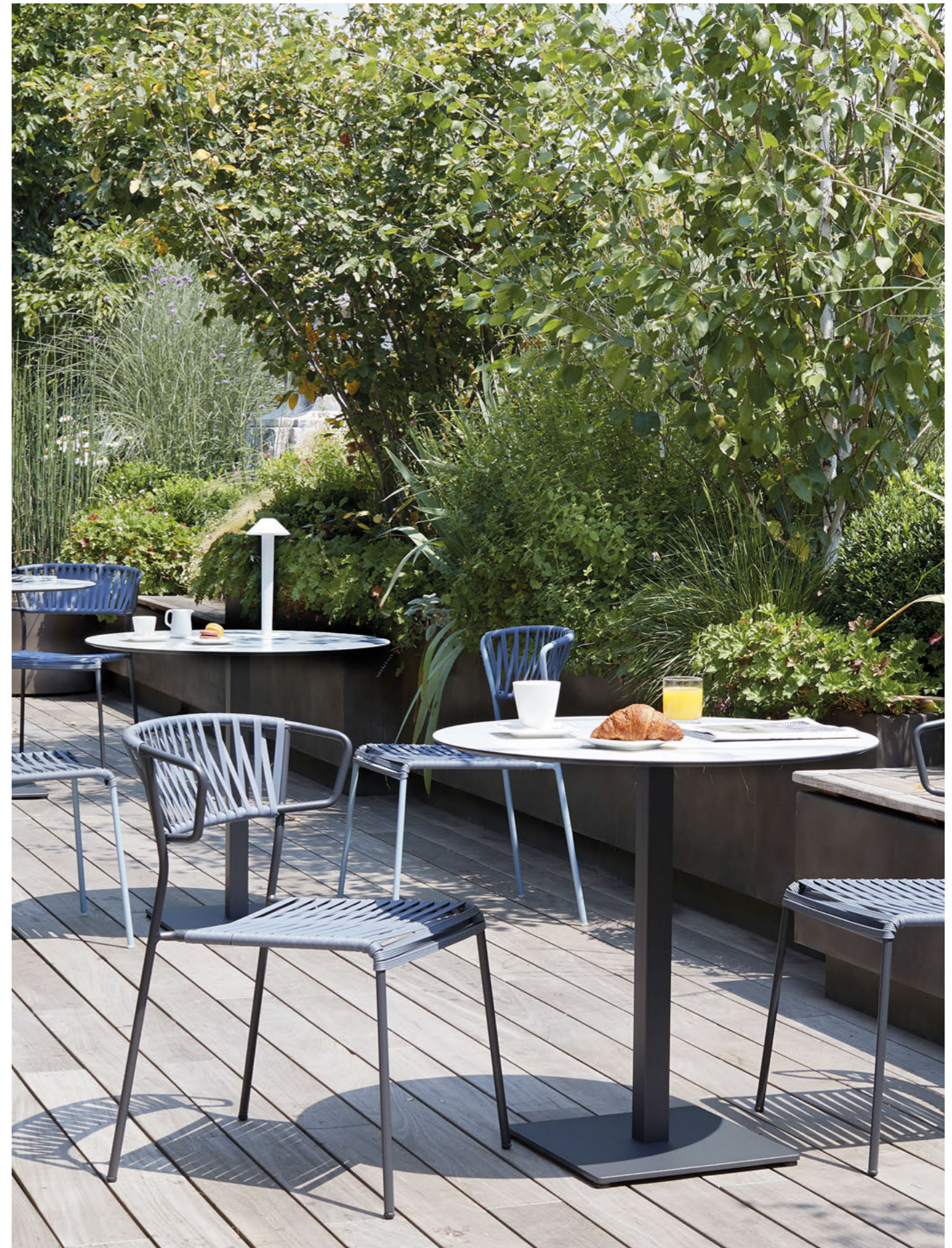
Armchair Poltrona Lisa Club, art. 2873 Chair Sedia Lisa Club, art. 2874 Base Tiffany, art. 5182

Telaio in acciaio zincato e verniciato a polvere, intreccio in estruso di PVC.