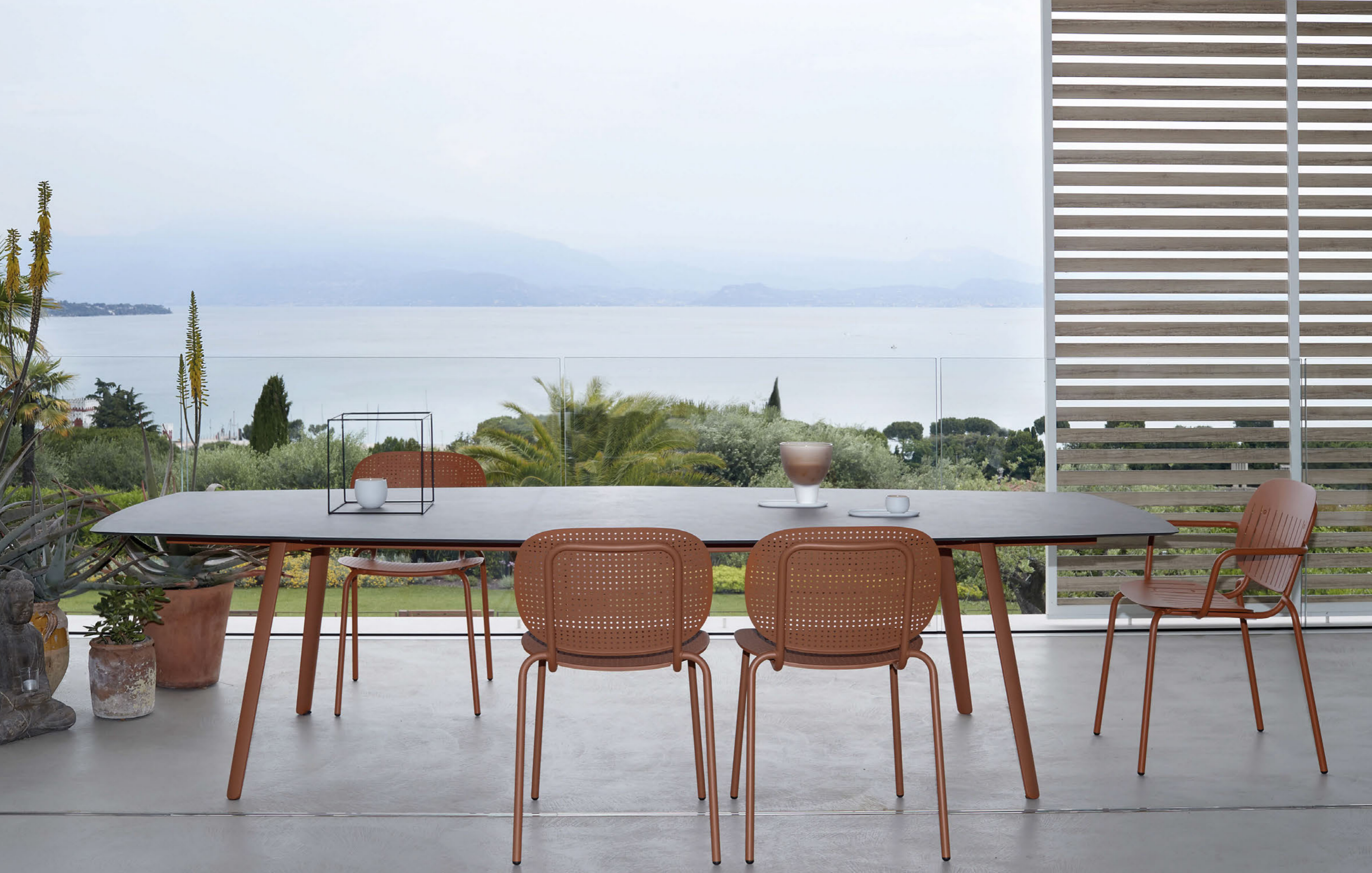
Hexagonal Table Tavolo Squid esagonale - 300x130, art.2437 Armchair Poltrona Si-Si Barcode, art. 2507 Chair Sedia Si-Si Dots, art. 2505