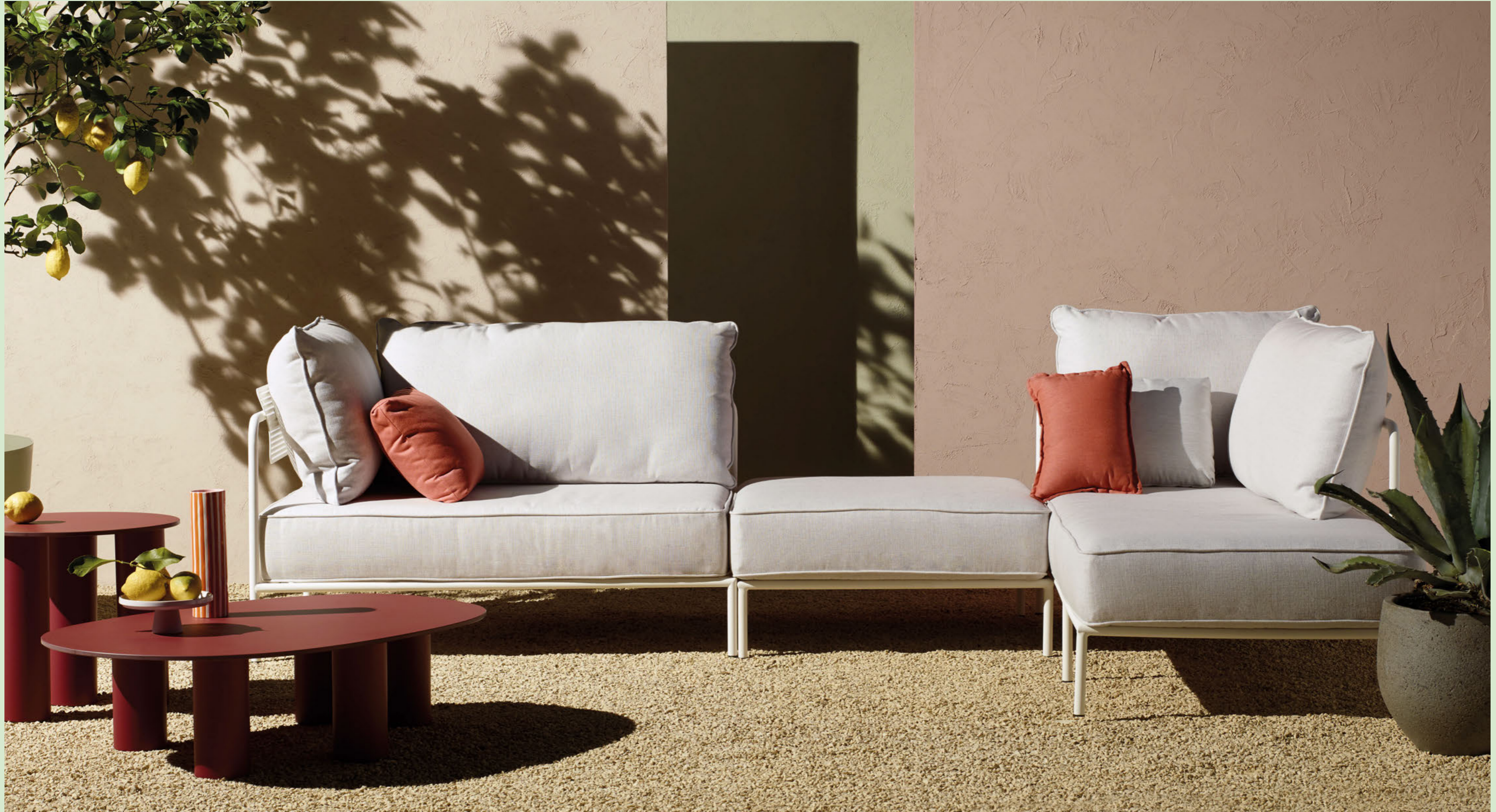
Modular system Sistema modulare Flap, art. 2887 - 2904 - 2902

(En) The Flap modular upholstered furniture family extends to incorporate three new components: an armchair, a pouf, and a chaise longue. These elements allowing further compositions while maintaining a rhythmic and harmonious style, are distinguished by the flaps, inclined ailerons on which the large backrest cushions rest. (It) La famiglia di imbottiti modulari Flap si estende ad inglobare tre nuovi componenti: una poltrona, un pouf e una chaise longue. Questi pezzi permettono di articolare e ritmare ulteriormente la composizione delle sedute contraddistinte dai flaps, gli alettoni inclinati a cui si appoggiano gli ampi cuscini dello schienale.