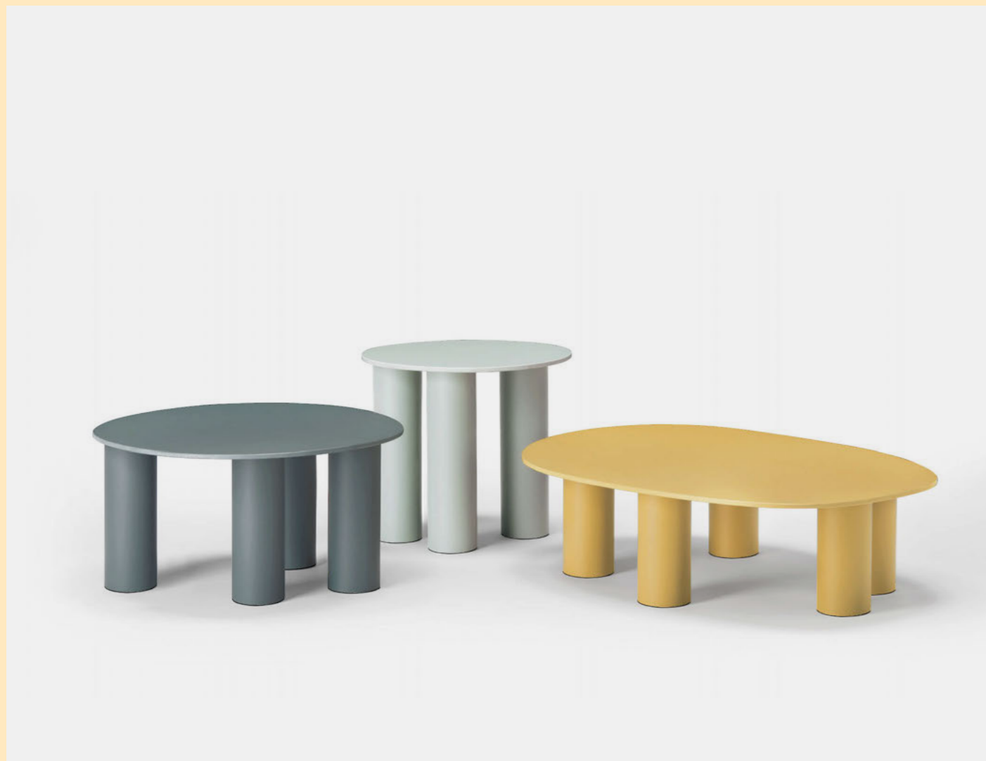
Coffee Table Hyppo, art. 2757, 2756, 2758

(En) The result of playful experimentation, the Hyppo coffee-table family is designed for outdoor use but adapts with versatility to indoor spaces. The inspiration, clear even from the name itself, is linked to the morphology of the hippopotamus and is revealed in the design of the aluminium legs, large and sculptural. (It) Esito di una sperimentazione ludica, la famiglia di coffee-table Hyppo è pensata per l'outdoor, ma si adatta con versatilità anche agli spazi indoor. L'ispirazione, rivendicata fin dal nome, si lega alla morfologia dell'ippopotamo e si rivela nel disegno delle gambe in alluminio, importanti e scultoree.