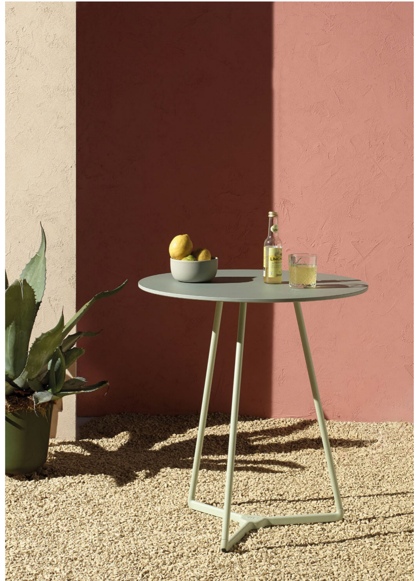
3 Legs Base Atomo, art. 5032 h.73