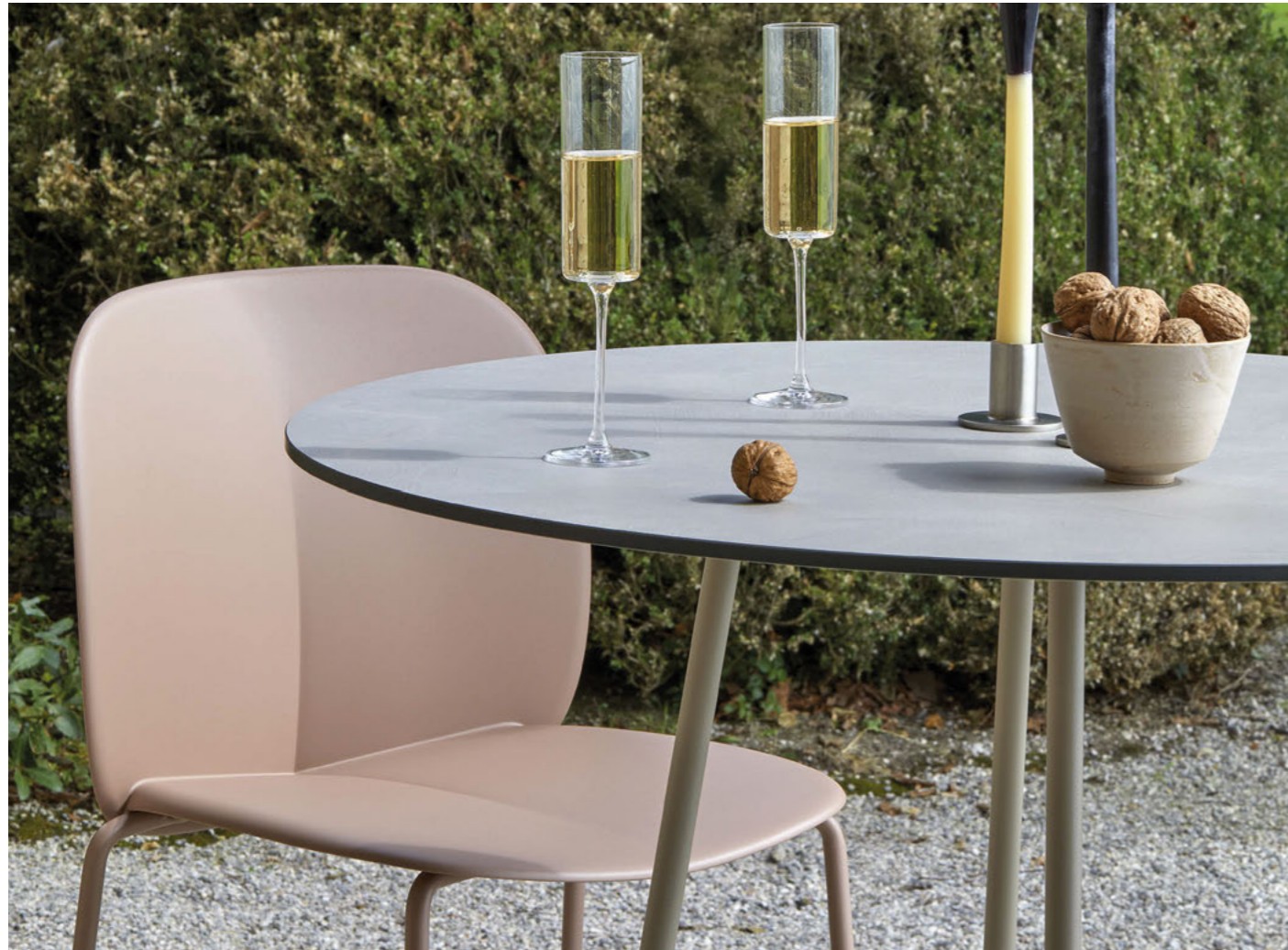
Barstool Sgabello Mentha, art. 2715 h.75 4 Legs Base Atomo, art. 5035 h.109