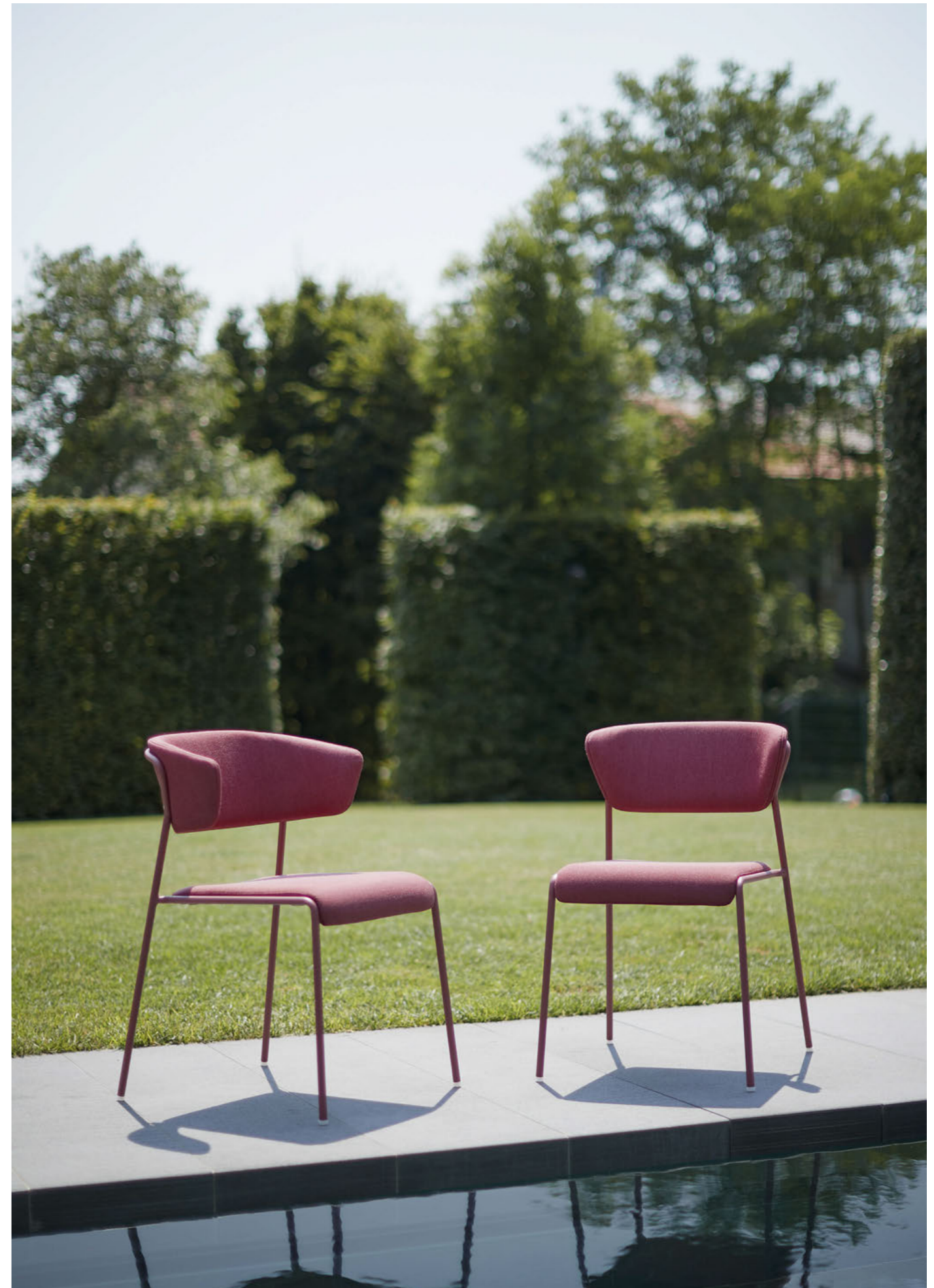
Armchair Poltrona Lisa Waterproof, art. 2860 Chair Sedia Lisa Waterproof, art. 2861