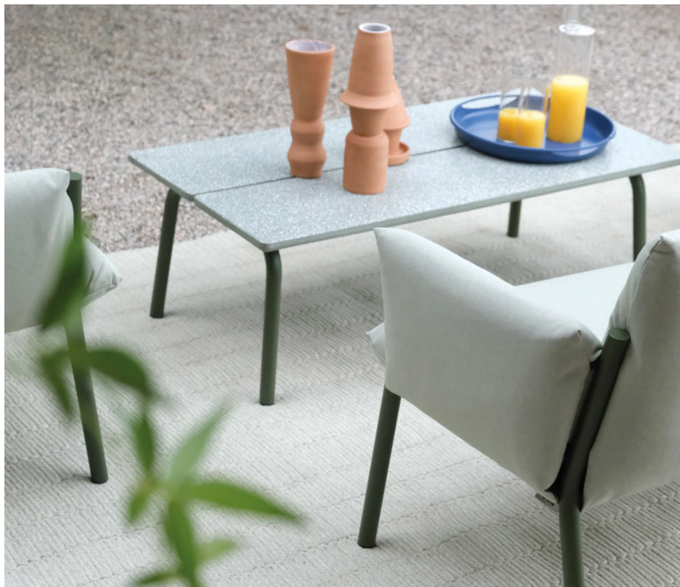
Lounge Armchair Poltrona Brezza Lounge, art. 2901 Brezza Sofa, art. 2900 Low table Tavolino Brezza, art. 2745

(En) The collection Brezza includes a low coffee table characterized by two large slats, available in concrete or HPL versions. (It) La collezione Brezza include un tavolino basso caratterizzato da due grandi doghe, disponibili nella versione cemento o HPL.