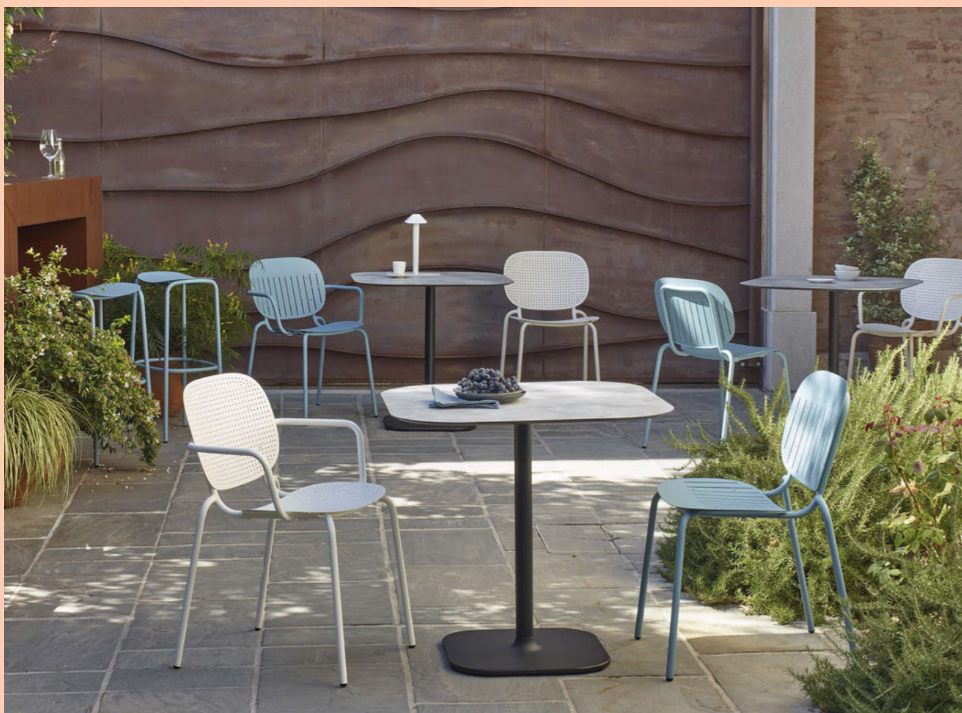
Chair Sedia Si-Si Dots, art. 2505 Armchair Poltrona Si-Si Dots, art. 2504 Chair Sedia Si-Si Barcode, art. 2508 Armchair Poltrona Si-Si Barcode, art. 2507 Base Rhino h.73, art. 5184

Zinc and polyester powder coated steel frame.