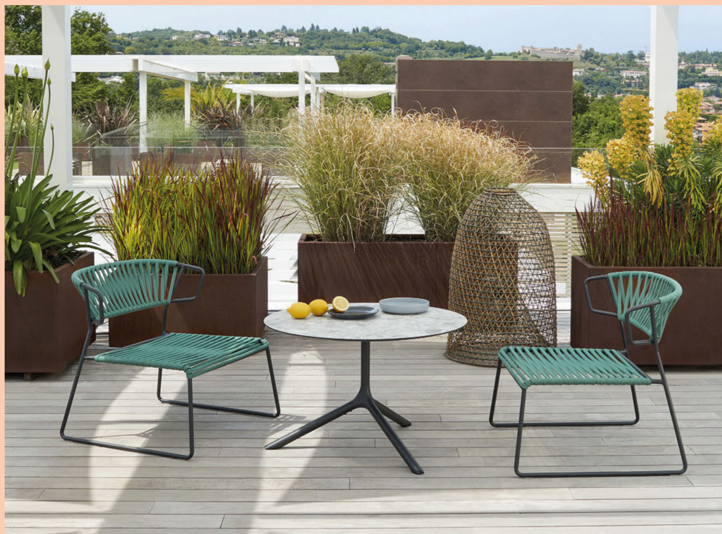
Lounge armchair Poltrona Lisa Lounge Filò, art. 2878

Zinc and polyester powder coated steel frame, braided in nautical rope.