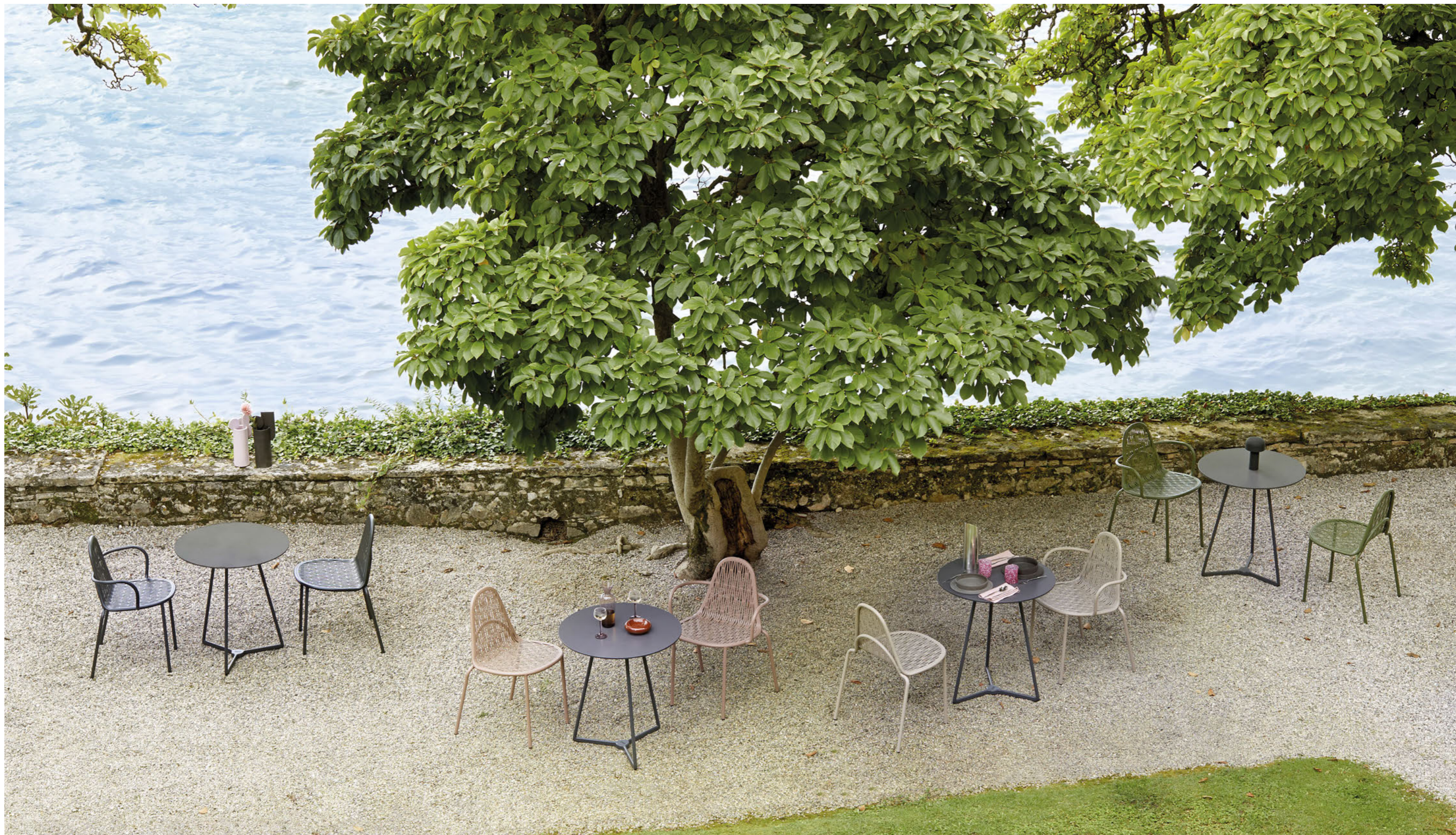
3 Legs Base Atomo, art. 5032 h.73 Chair Sedia Malvasia, art. 2906 Armchair Poltrona Malvasia, art. 2907