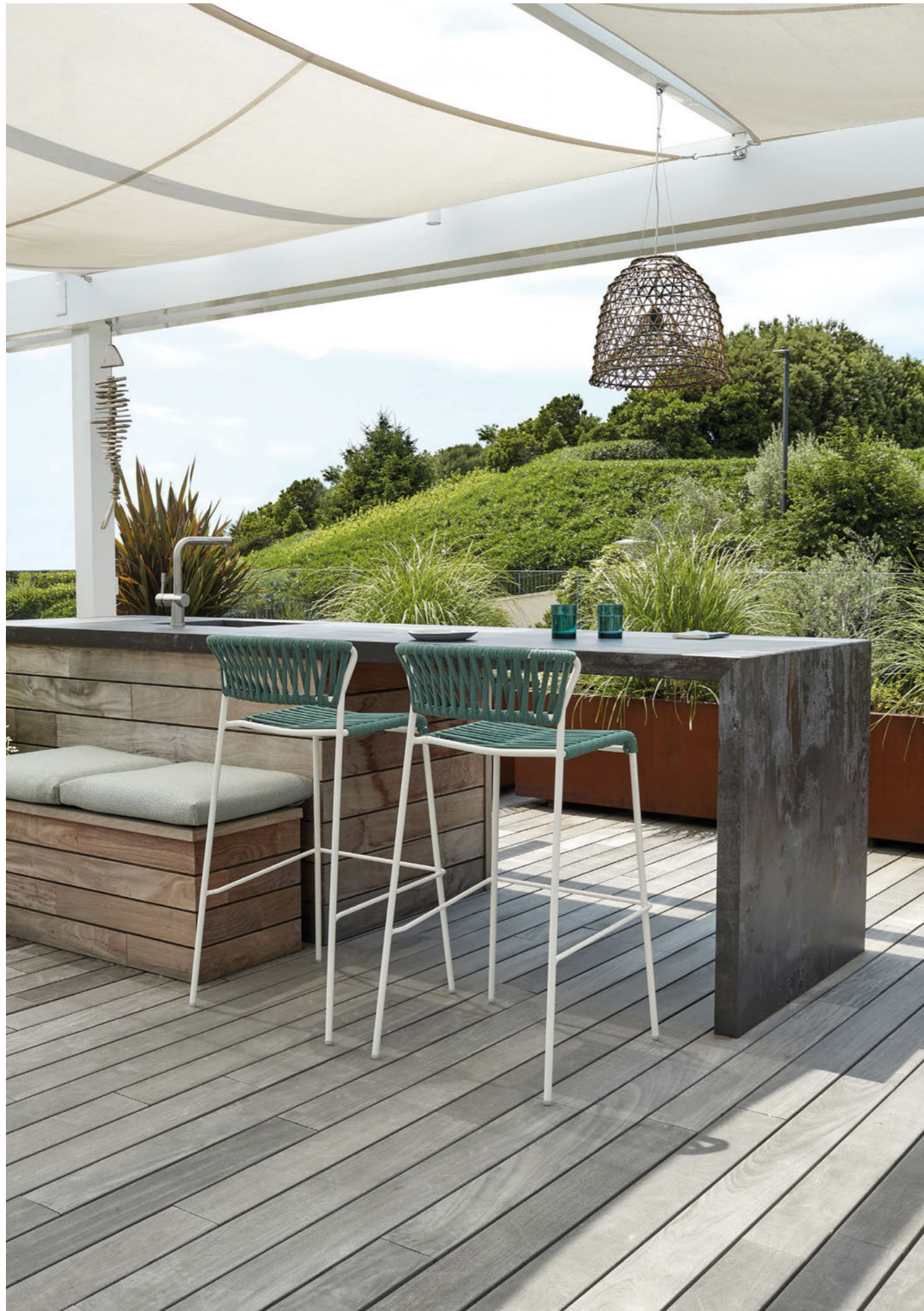
Barstool Sgabello Lisa Filò, art. 2871 h.75