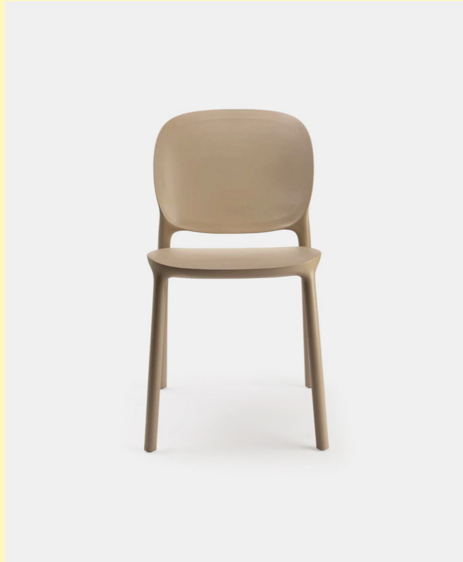
Chair Sedia Hug, art. 2380

(En) The HUG chair collection is made entirely from second-life materials. There are two variants: an all-technopolymer version, perfect for outdoor environments, and a softer one with the addition of a seat cushion and padded band covered in fabric, even more enveloping. (It) La collezione di sedute HUG è realizzata al 100% con materiali al secondo ciclo di vita. Due sono le varianti: una versione tutta in tecnopolimero, perfetta per l'outdoor, un'altra più aggraziata con l'aggiunta di cuscino di seduta e fascia imbottita e rivestita in tessuto, ancora più avvolgente.