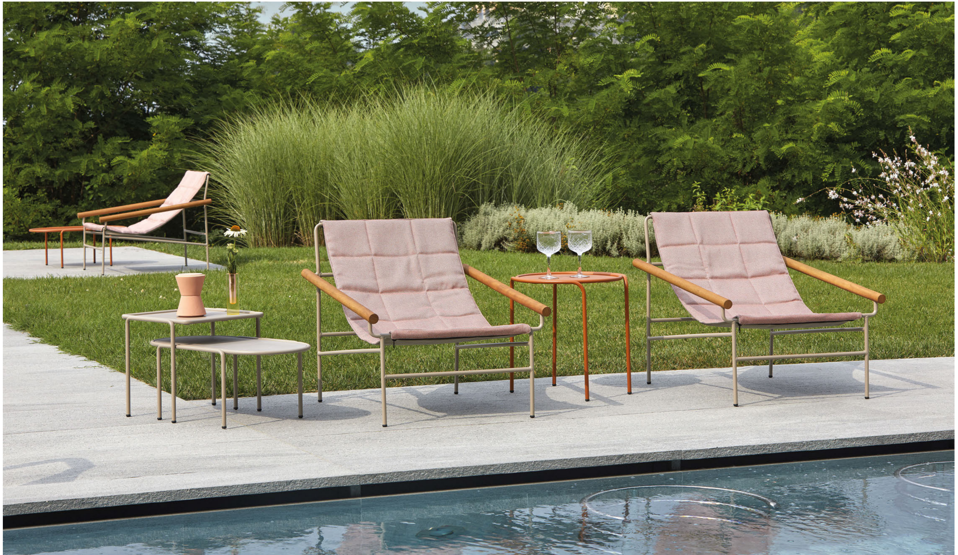
Lounge armchair Poltrona Dress_Code Glam, art. 2583 Round Coffee table rotondo Dress_Code, art. 2742 Ø 45 h.50 Oval Coffee table ovale Dress_Code, art. 2744 36x77 h.30 Square Coffee table quadrato Dress_Code, art. 2743 41x41 h.40