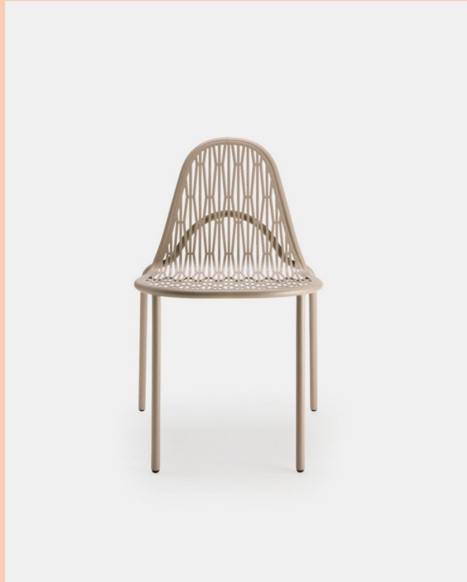
Chair Sedia Malvasia, art. 2906

(En) Malvasia is an outdoor seat that projects graceful and straight patterns of lights and shadows through its metal weaves. Evoking the warp and weft of a fabric, but also the play of shadows of a tree canopy, Malvasia is a seat that lends itself to animate any outdoor space, even terraces and gardens. (It) Malvasia è una seduta da esterni che proietta attraverso le sue trame metalliche garbati e rigorosi intrecci di luci e ombre. Evocando la trama e l'ordito di un tessuto, ma anche i giochi d'ombra della chioma di un albero, Malvasia è una seduta che si presta ad animare qualsiasi spazio esterno, sia questo un dehors, una terrazza o un giardino.