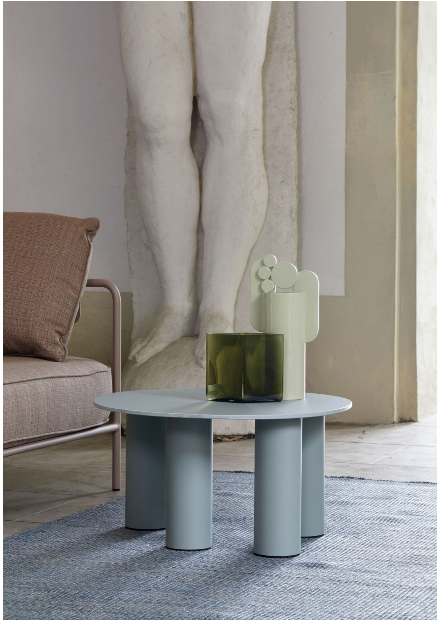
Coffee Table Hyppo, art. 2757