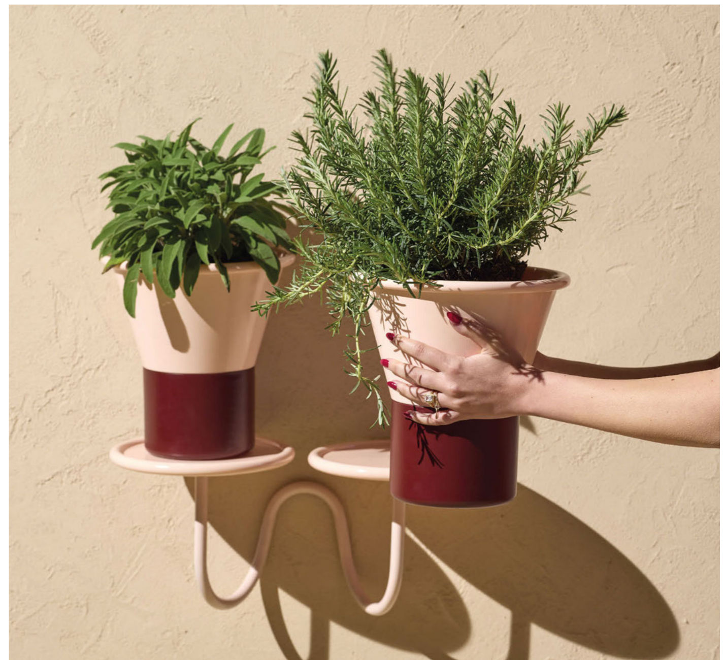
Vases Vasi Mimosa, art. 2958 h.31 Vases Vasi Mimosa, art. 2957 h.25

(En) With a strong graphic impact, this timeless duo of aluminium vases recalls both in silhouette and in the play of shades the morphology of a flower in its connection between peduncle and corolla. Suitable for accommodating diverse compositions, they enhance the presence of flowers, making them protagonists of our daily lives. (It) Dal forte impatto grafico, questo duo di vasi in alluminio rievoca tanto nella silhouette che nel gioco di sfumature la morfologia di un fiore nel suo innesto tra peduncolo e corolla. Adatti ad accogliere composizioni eterogenee, esaltano la presenza dei fiori, rendendoli protagonisti del nostro quotidiano.