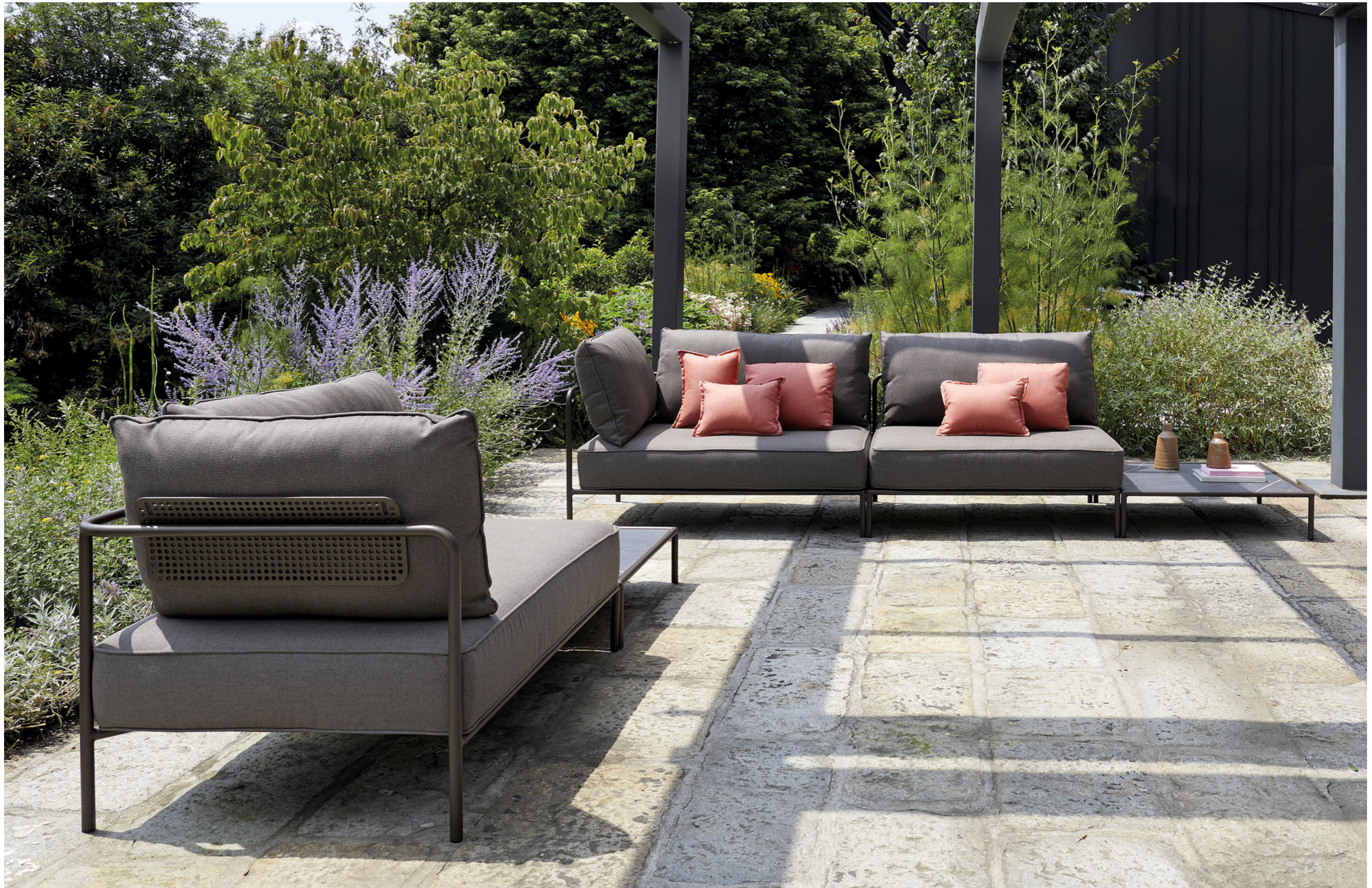
Occasional table Tavolino Flap, art. 2718 Modular system Sistema modulare Flap, art. 2887 - 2888